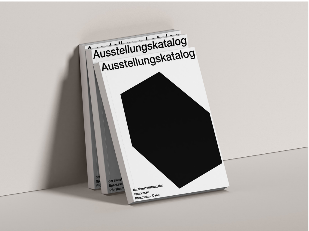
Visitenkarte und Ausstellungskatalog