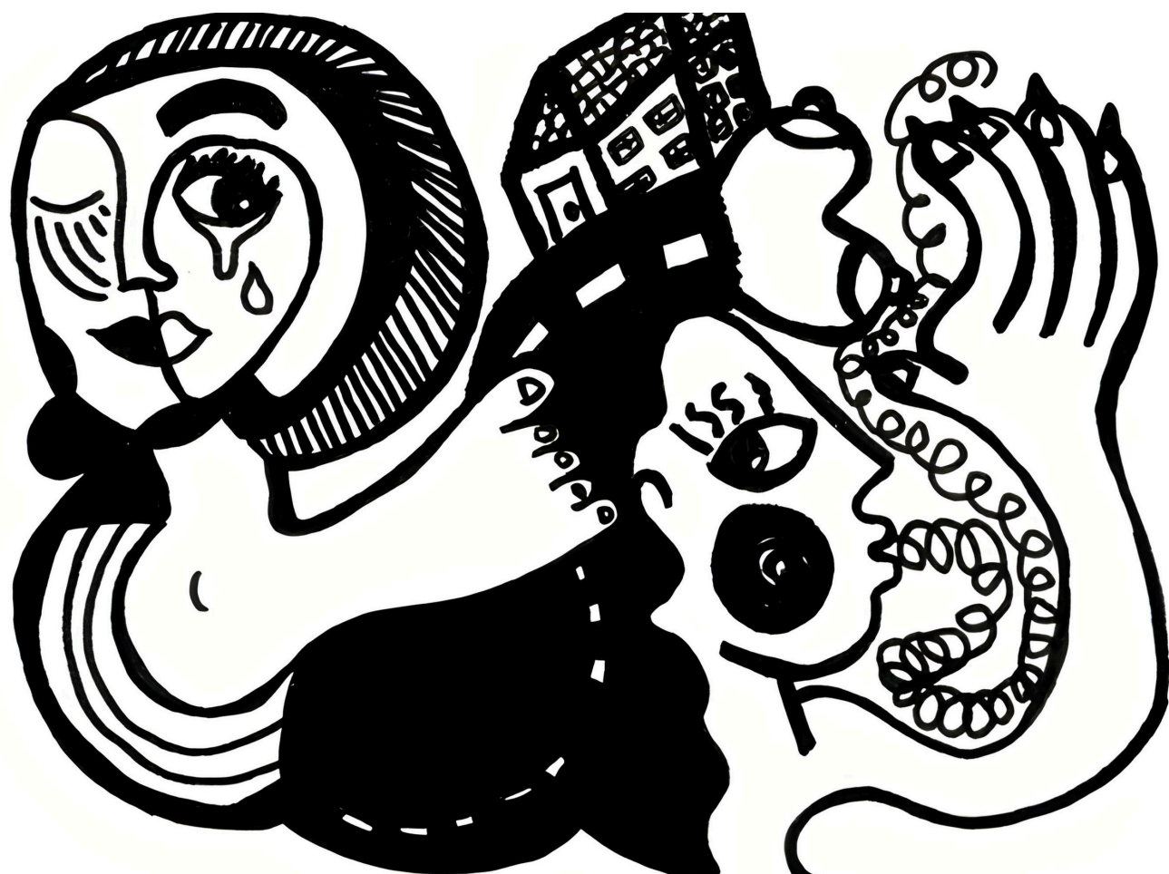
Série le peuple de ma tête, Marqueur à l'acrylique noir et encre de chine, 21x14,8 cm