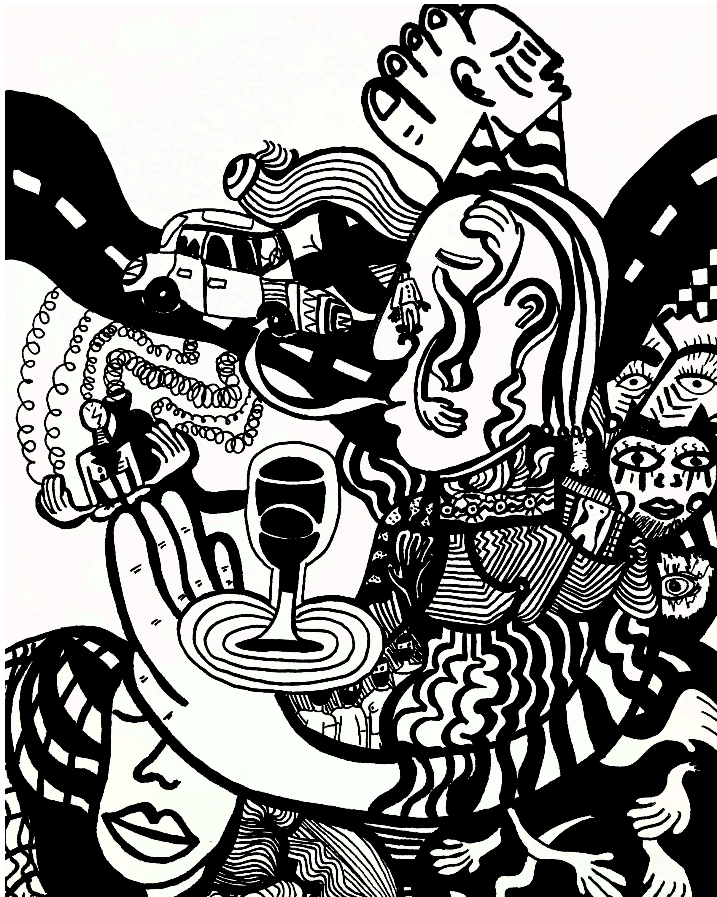
T'as une tête à boire du vent, Marqueur à l'huile et encre de chine sur papier canson recyclé, 29,7 x 21 cm

"J'écoute le dessin qui naît sous mes yeux. "