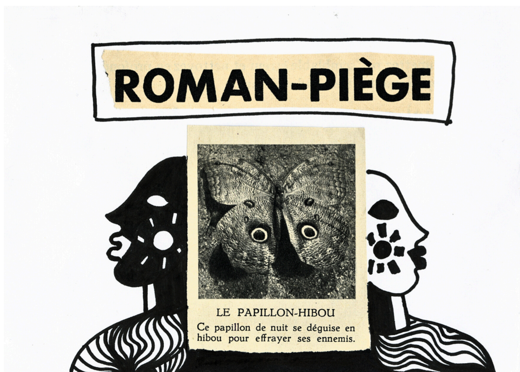
ROMAN PIÈGE, première de couverture du livre auto édité de la série "le Peuple de ma tête, 21x14,8 cm