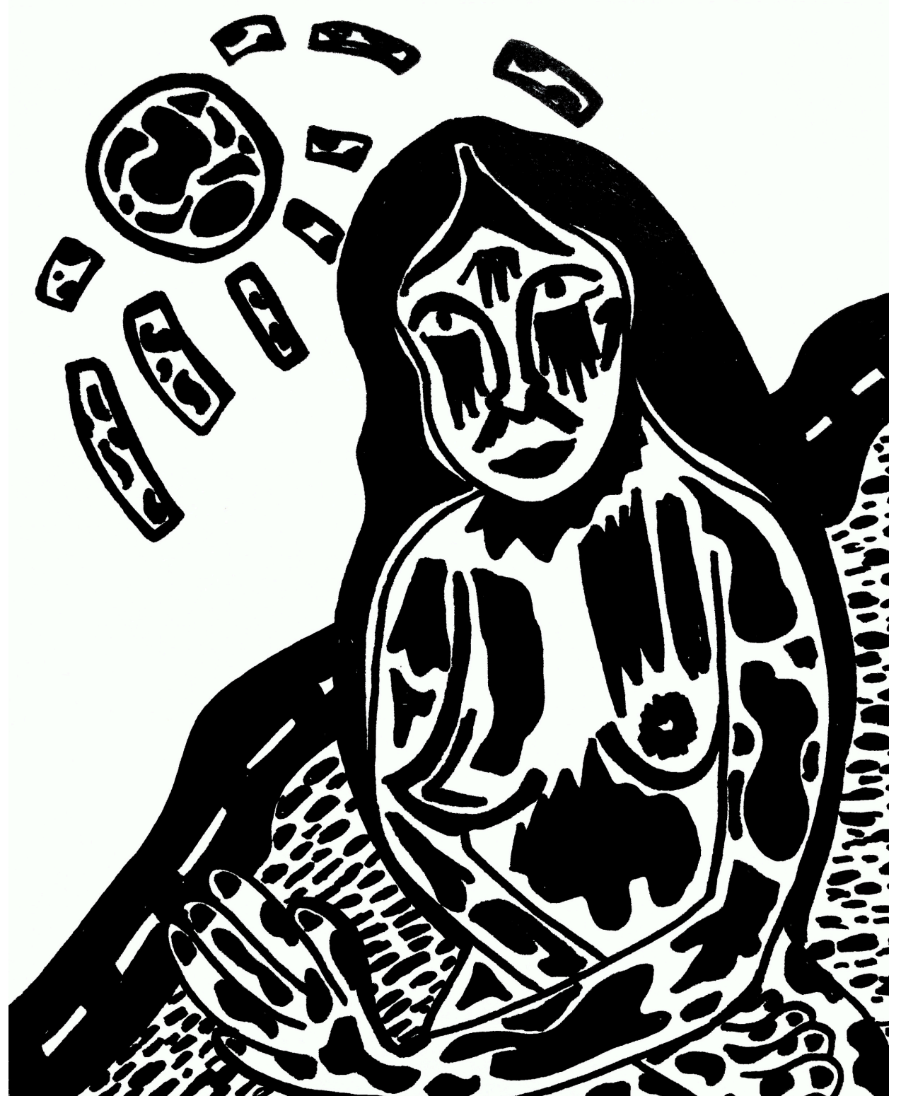
La solitude, Marqueur à l'acrylique noir, 29,7x42 cm