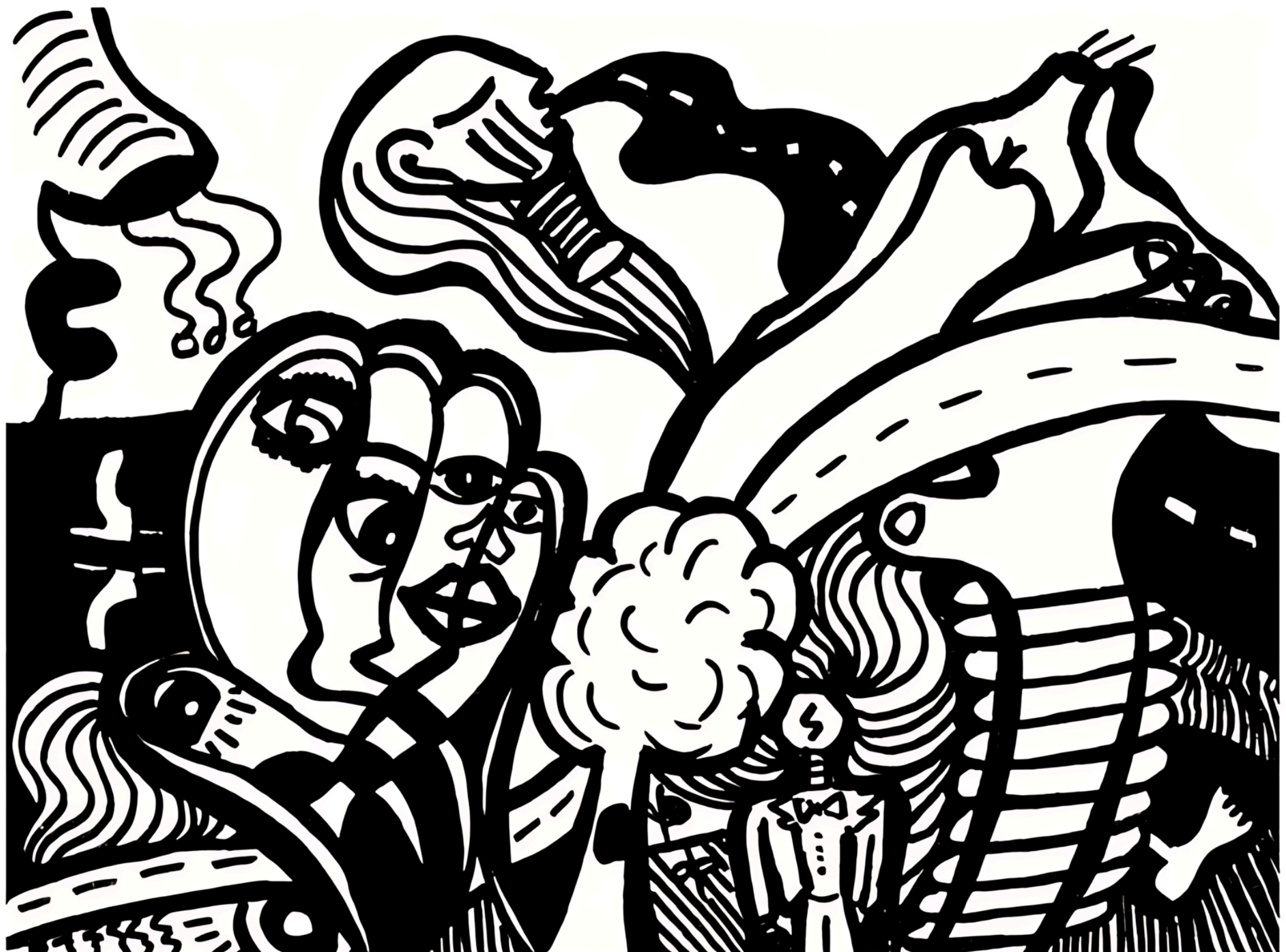
Série le peuple de ma tête, Marqueur à l'acrylique noir et encre de chine, 21x14,8 cm