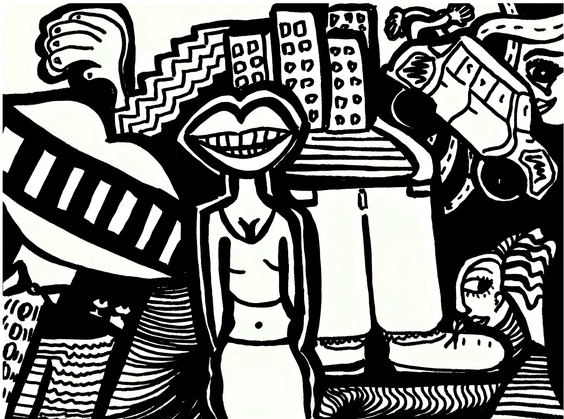
Série le peuple de ma tête, Marqueur à l'acrylique noir et encre de chine, 21x14,8 cm