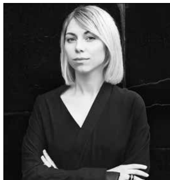
Emilija Škarnulytė