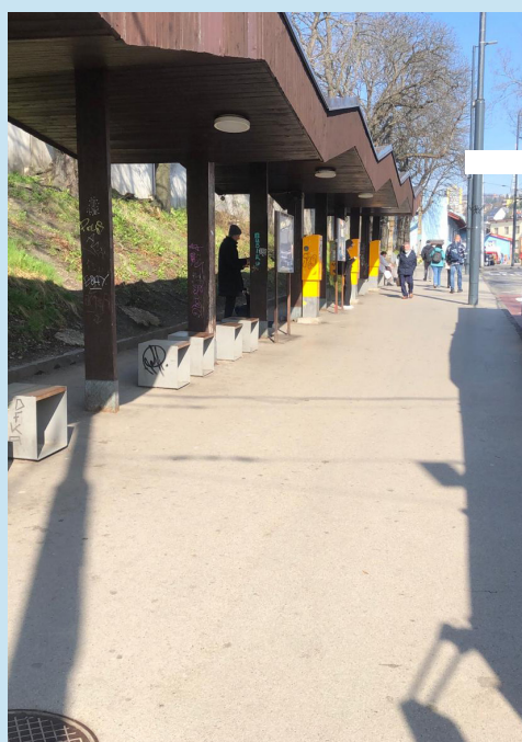
Prekvapivo čisté okolie Hlavnej stanice

Premýšľal som, či mám tento môj príbeh uverejniť po tak dlhej dobe. Možno sa fajčiari a fajčiarky zamyslia. Prial by som si, aby ma niektorí nasledovali.