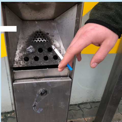
Fajčiari a ohorky na verejnosti

Neuveriteľne zadymená miestnosť, dym sa dal doslova krájať! Bolo jedno, že sme tam boli aj nefajčiari. Priznám sa, že som tým neuveriteľne trpel. Snažil som sa týmto poradám vyhýbať, no väčšinou sa to nedalo.