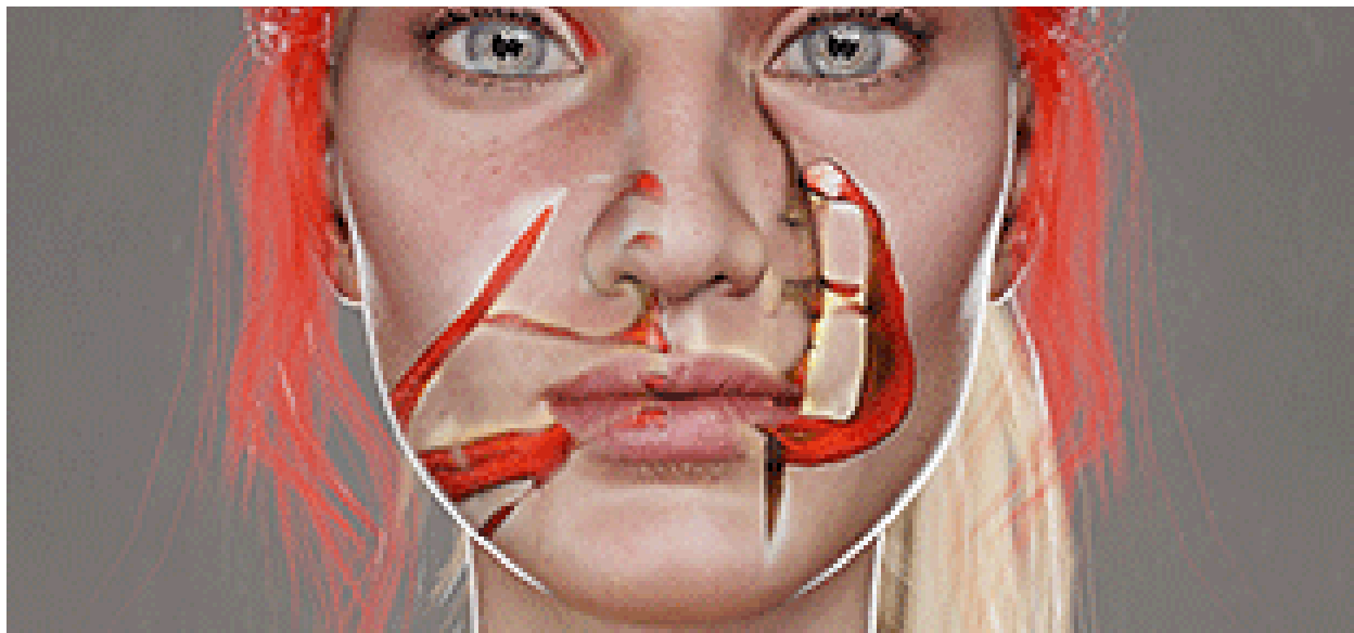
Online zine: Metamorphosis