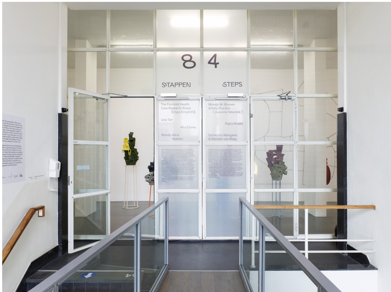
Exhibition overview 84 STEPS at Kunstinstituut Melly, Rotterdam, 2021.

84 STEPS was initiated to make up for the lack of publicity of the past period, but above all to exhibit art in a more social and dynamic way.