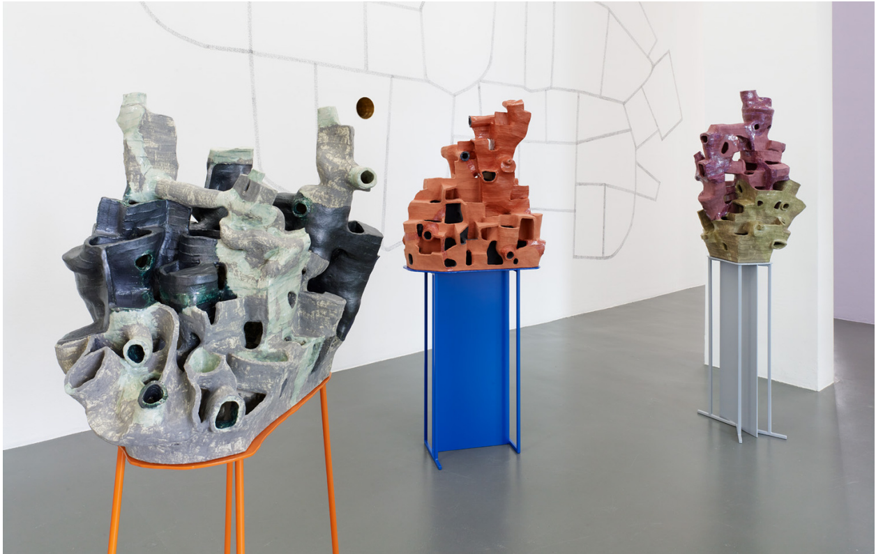
Domenico Mangano & Marieke van Rooy, Dilution Cafeteria , 2021, glazed ceramic, painted steel, and charcoal, courtesy of the artists and Magazzino d'Arte Moderna, Rome, Italy. Exhibition overview 84 STEPS at Kunstinstituut Melly, Rotterdam, 2021.