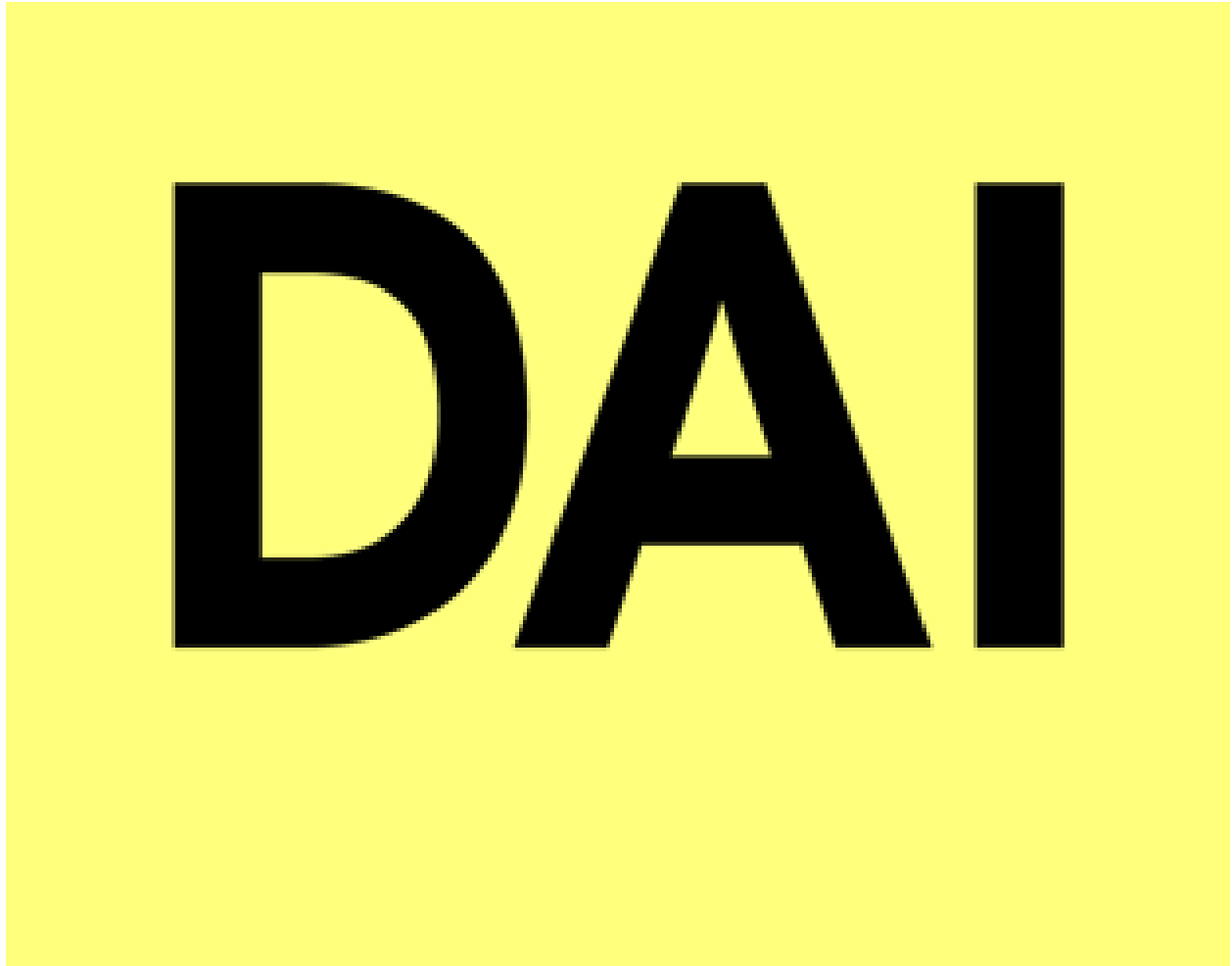
Dutch Art Institute