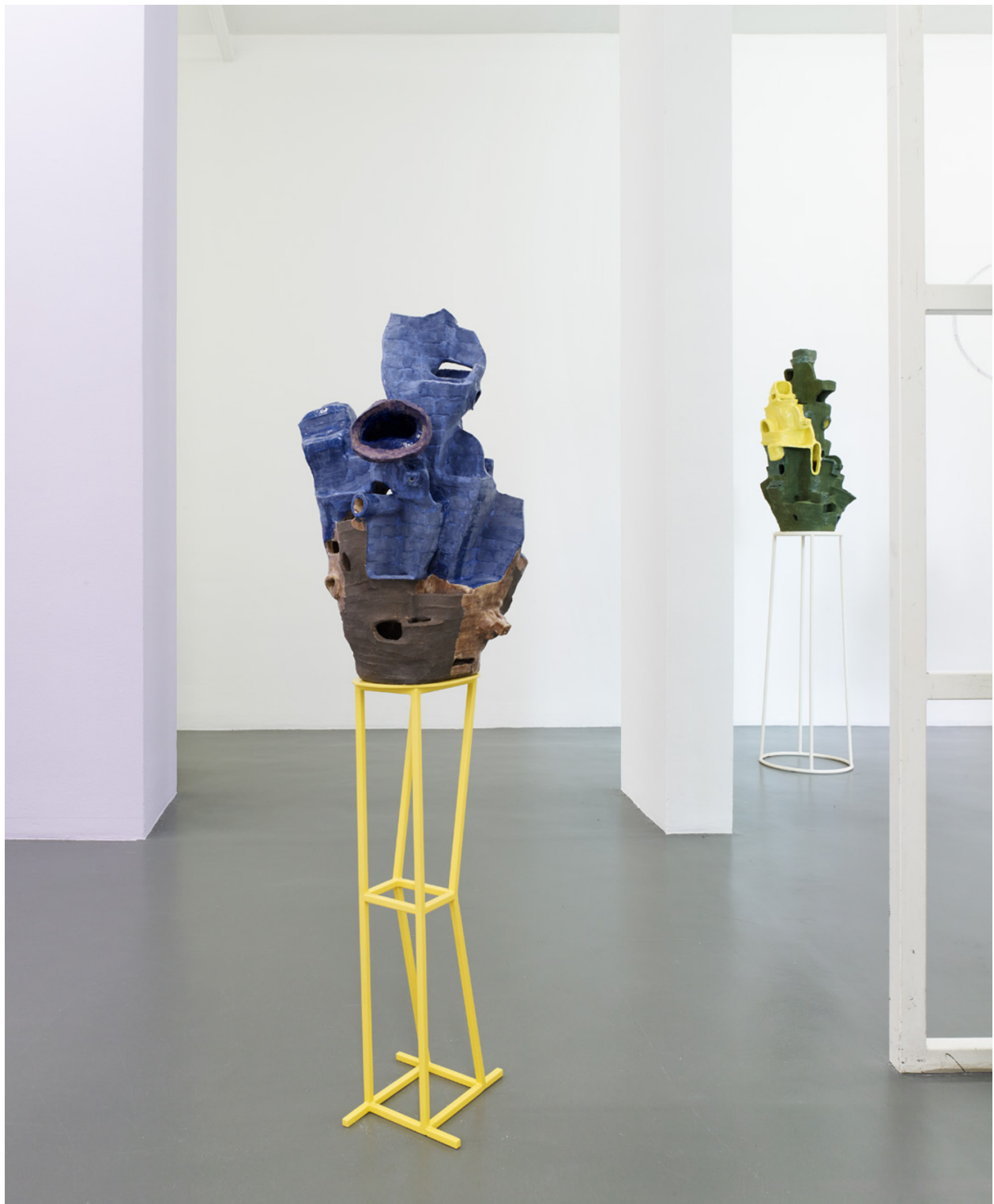
Domenico Mangano & Marieke van Rooy, Dilution Cafeteria , 2021, glazed ceramic, painted steel, and charcoal, courtesy of the artists and Magazzino d'Arte Moderna, Rome, Italy. Exhibition overview 84 STEPS at Kunstinstituut Melly, Rotterdam, 2021. Photographer: Kristien Daem

Mangano & Van Rooy presenteren hun onderzoek naar deze benadering in hun project The Dilution Cafeteria . Hun keramische sculpturen wachten mij op hoge poten op wanneer ik de tentoonstellingsruimte op de derde verdieping betreed. De architecturale figuren in groen, roze en geel hebben iets spontaans en organisch in