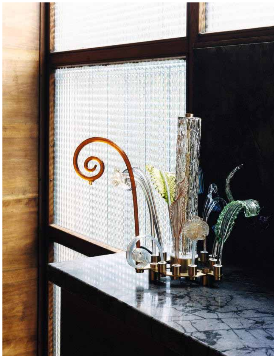
CI-DESSUS, LAMPE DE TABLE PAST & FUTURE, STRUCTURE EN LAITON AVEC FINITION DORÉE, PAMPILLES EN VERRE DE MURANO, DESIGN PIET HEIN EEK, VERONESE .