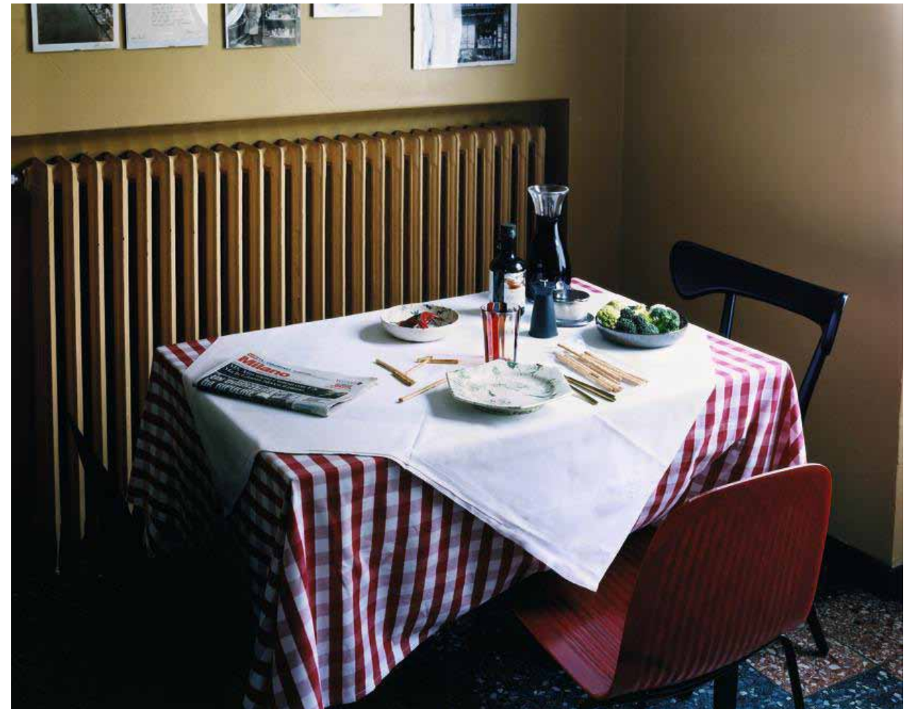
PAGE DE DROITE, EN HAUT, TABOURET ACCIAIO, ASSISE EN CUIR PERFORÉ, STRUCTURE EN ACIER, DESIGN MAX LIPSEY, CAPPellini. EN BAS, CHAISE FIELD, COQUE EN MATÉRIAU COMPOSITE DE RÉSINE ET DE FIBRES DE LIN, STRUCTURE EN MÉTAL, DESIGN PHILIPPE NIGRO, SAINTLUC. CHAISE CAFESTUHL, DOSSIER SCULPTÉ EN BOIS DE HÊTRE, DESIGN NIGEL COATES, WIENER GTV DESIGN. ASSIETTE ET BOL EN FAÏENCE TERRE MÊLÉE, DESIGN PASCALE MESTRE, EMPREINTES. VERRE EN VERRE DE MURANO, THE CONRAN SHOP. MOULIN À POIVRE PEPE LE MOKO, EN PLASTIQUE ET ACIER INOXYDABLE, DESIGN JASPER MORRISON, ALESSI.