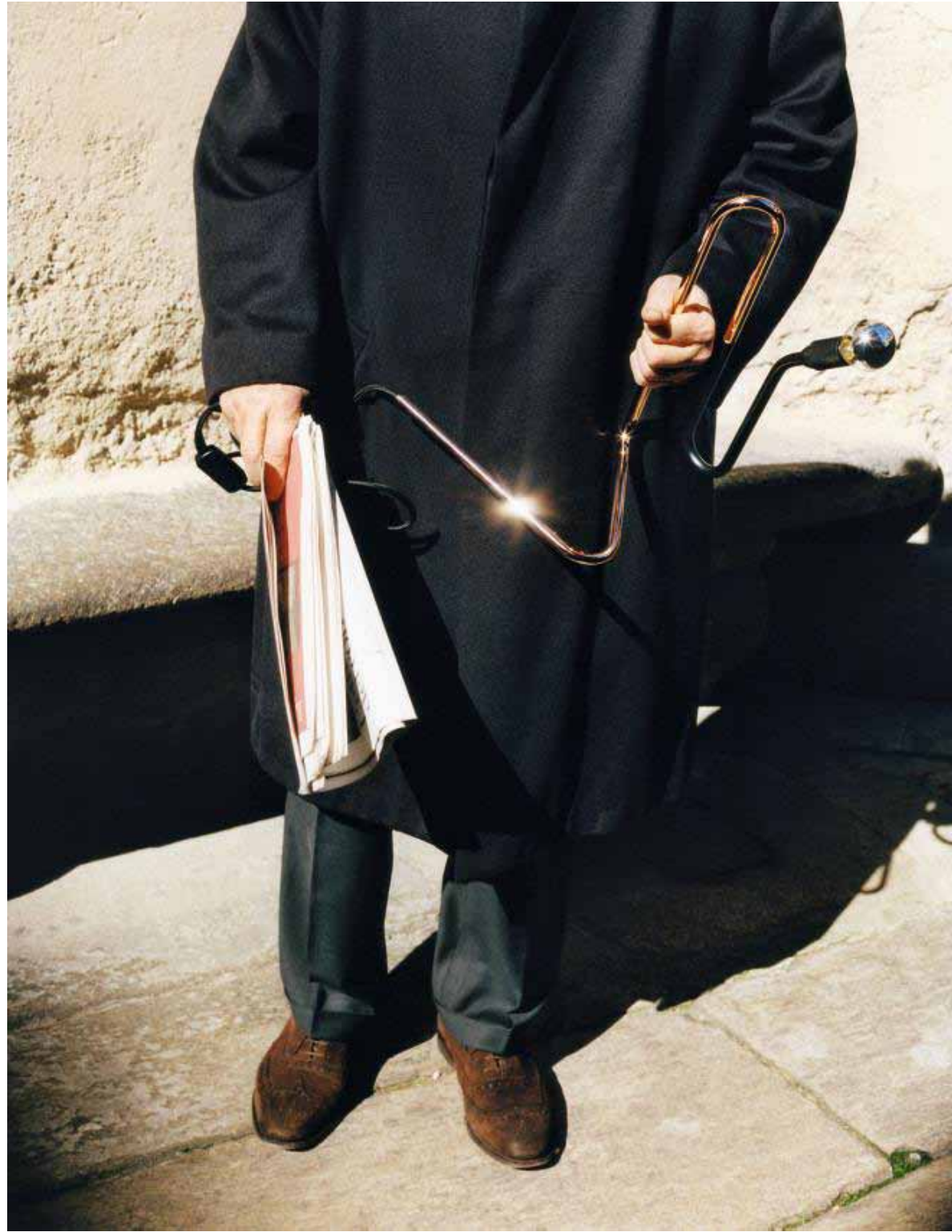
CI-DESSUS, LAMPE À POSER ONDULÉE, TUBE CUIVRÉ ET NOIR MAT, DESIGN CHAPE & MACHE, CINNA.