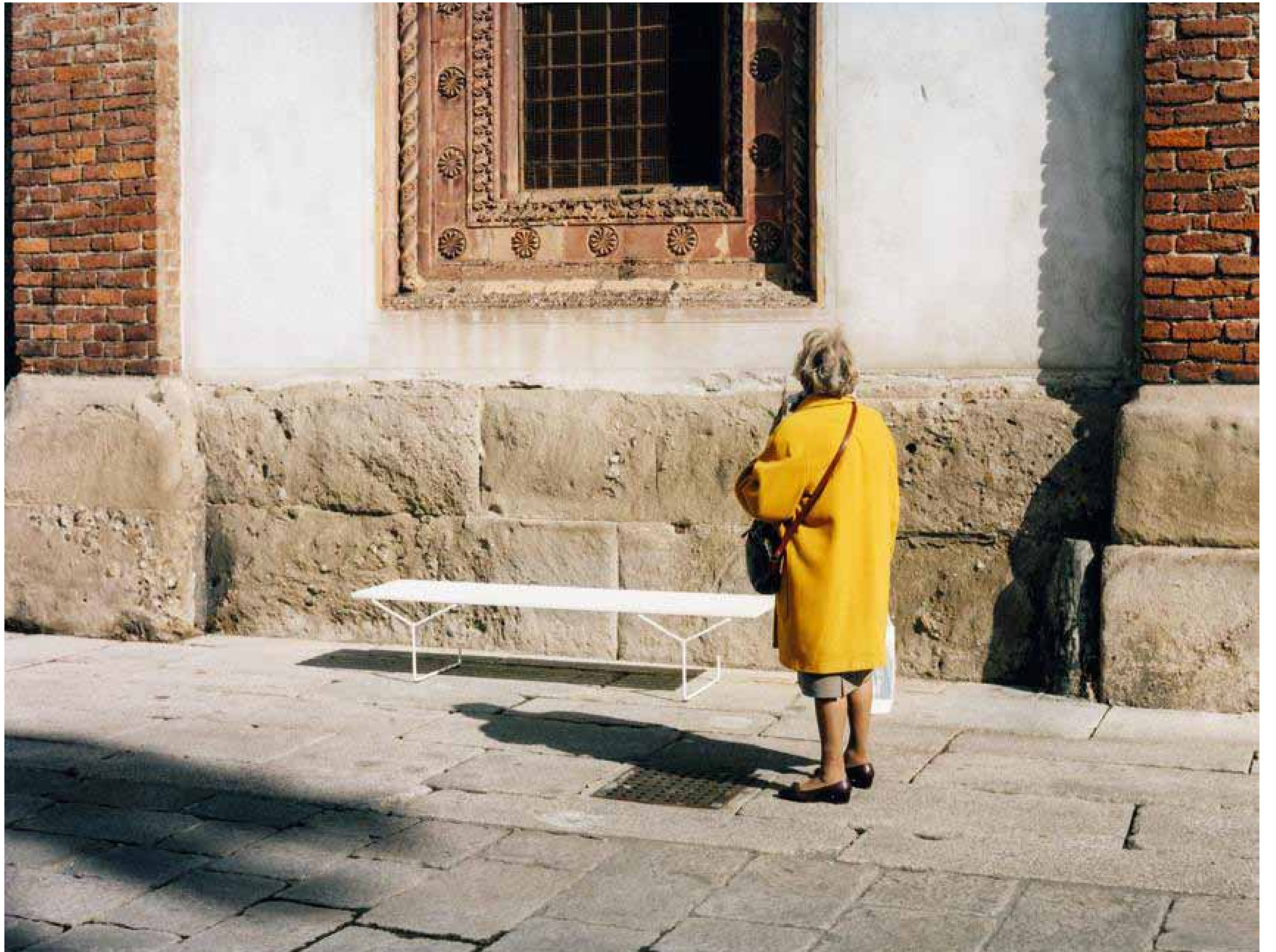
BANC BERTOIA, ASSISE EN LATTES DE BOIS LAQUÉ BLANC, STRUCTURE EN MÉTAL, DESIGN HARRY BERTOIA, KNOLL.