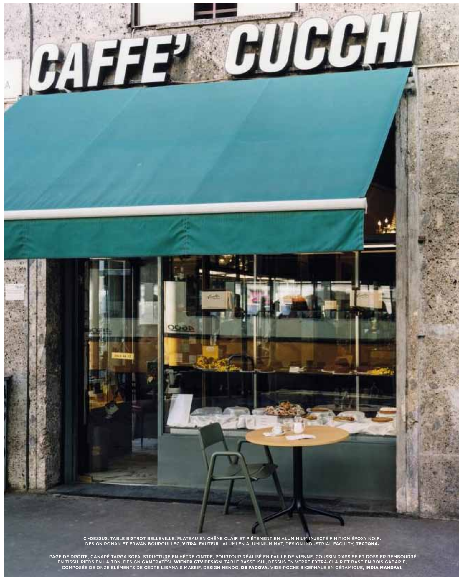
CI-DESSUS, TABLE BISTROT BELLEVILLE, PLATEAU EN CHÊNE CLAIR ET PIÉTEMENT EN ALUMINIUM INJECTÉ FINITION ÉPOXY NOIR, DESIGN RONAN ET ERWAN BOUROULLEC, VITRA . FAUTEUIL ALUMI EN ALUMINIUM MAT, DESIGN INDUSTRIAL FACILITY, TECTONA .