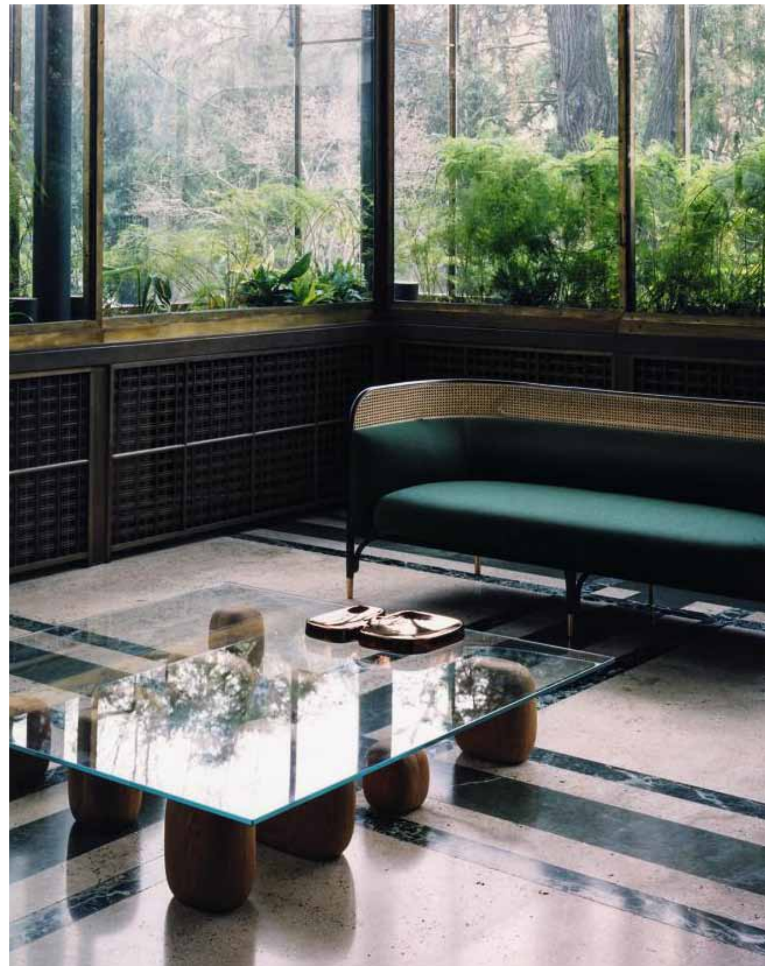
PAGE DE DROITE, CANAPÉ TARGA SOFA, STRUCTURE EN HÊTRE CINTRÉ, POURTOUR RÉALISÉ EN PAILLE DE VIENNE, COUSSIN D'ASSISE ET DOSSIER REMBOURRÉ EN TISSU, PIEDS EN LAITON, DESIGN GAMFRATESI, WIENER GTV DESIGN . TABLE BASSE ISHI, DESSUS EN VERRE EXTRA-CLAIR ET BASE EN BOIS GABARIÉ, COMPOSÉE DE ONZE ÉLÉMENTS DE CÈDRE LIBANAIS MASSIF, DESIGN NENDO, DE PADOVA . VIDE-POCHE BICÉPHALE EN CÉRAMIQUE, INDIA MAHDAVI .