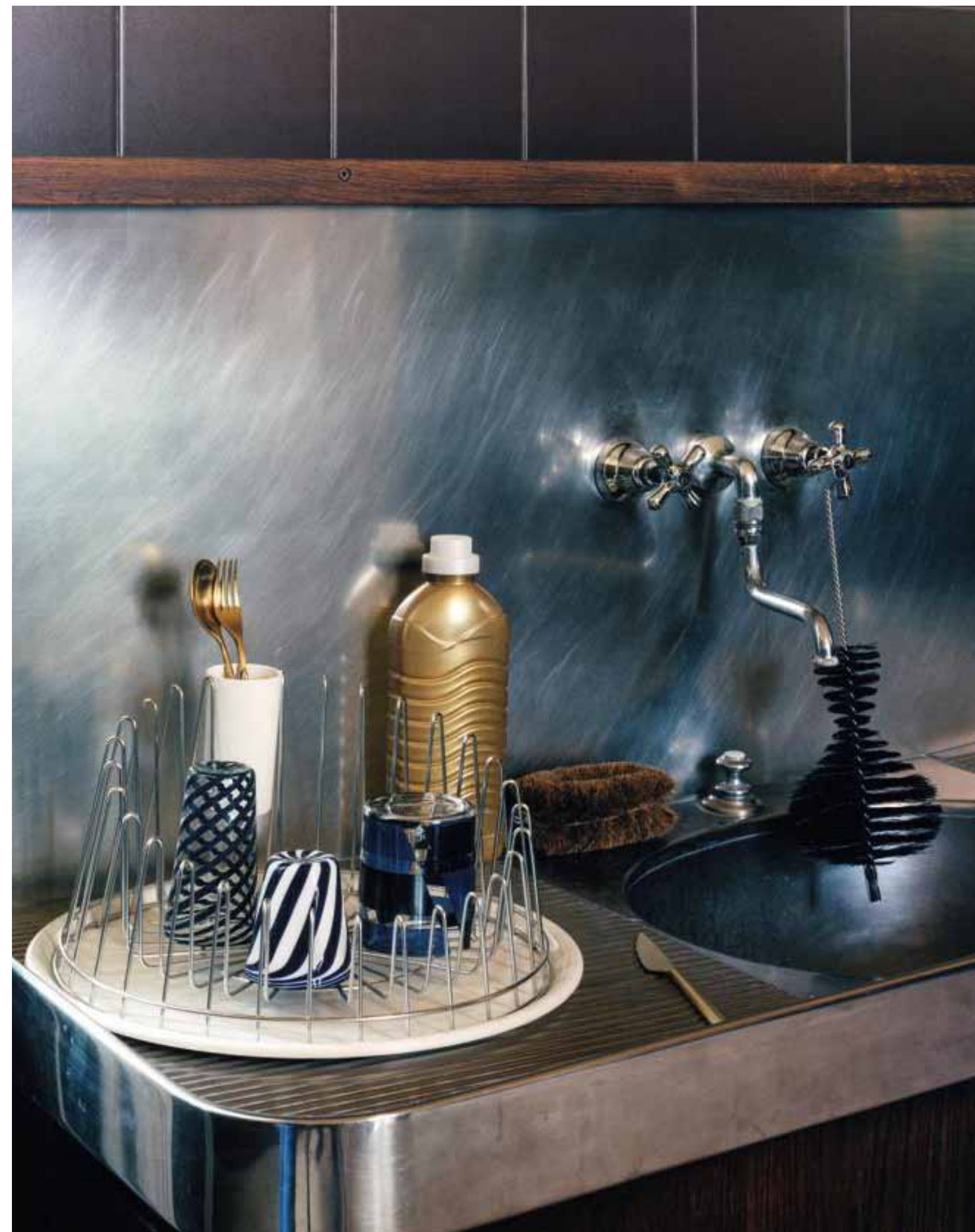
PAGE DE DROITE, ÉGOUTTOIR À VAISSELLE A TEMPO, EN ACIER INOXYDABLE BRILLANT AVEC ÉGOUTTOIR À COUVERTS ET PLATEAU EN RÉSINE THERMOPLASTIQUE, DESIGN PAULINE DELTOUR, ALESSI . COUVERTS LINEA ICE GOLD, EN ACIER INOXYDABLE AVEC FINITION OR BROSSÉ ET GOUPILLON NOIR, THE CONRAN SHOP . VERRES À SPIRALE, LAURENCE BRABANT ÉDITIONS . VERRE NEO, EN CRISTAL ÉMAILLÉ, SOUFFLÉ À LA BOUCHE ET PEINT À LA MAIN, DESIGN MARTINO GAMPER, LOBMEYR .