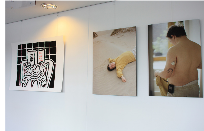
Afb. 1 en 2. Impressie Intiem, Stadskantoor Utrecht: afdeling Seksuele Gezondheid.