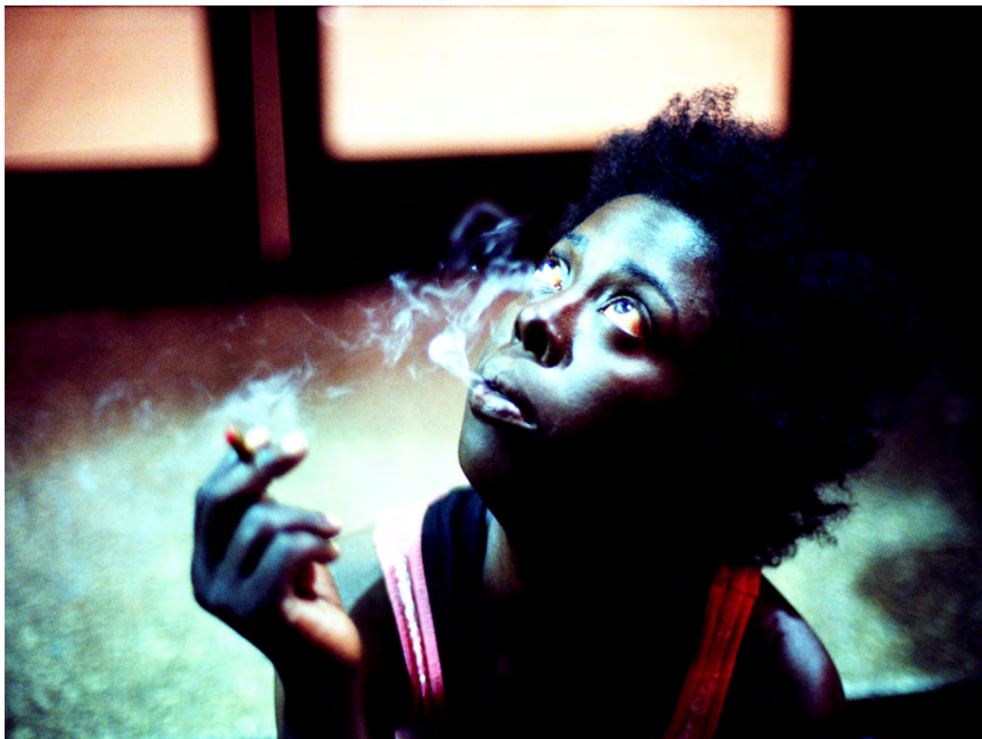
Woman Smoking, Khalik Allah