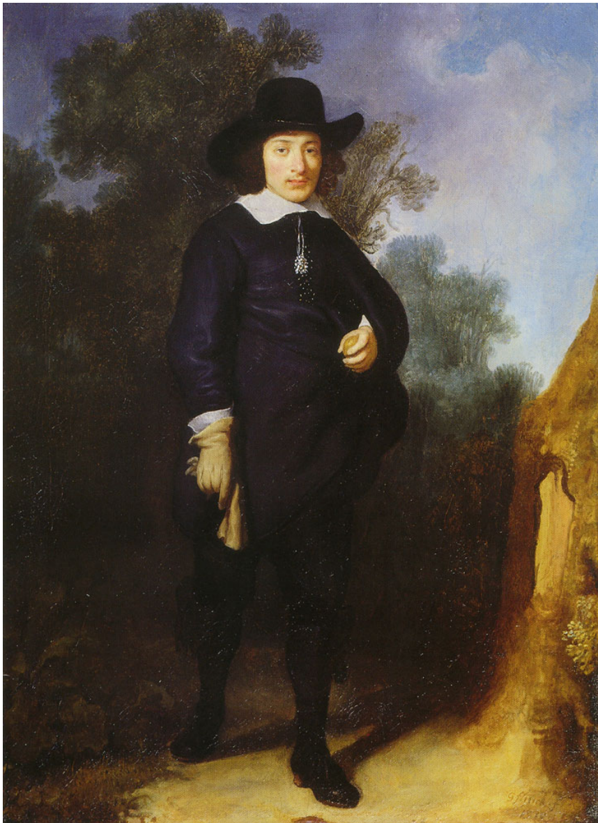
Figuur 3: Portret van Dirck Jacobsz. Leeuw, Govert Flinck, 1636. 10

Een ander prachtig voorbeeld van de doperse kledingnormen is het portret van Dirck Jacobsz. Leeuw, een rijke 17e-eeuwse Amsterdamse koopman, gemaakt door Govert Flinck (figuur 3). Voordat Leeuw zich liet dopen, werd hij geportretteerd zoals een koopman betaamde: hij droeg dure stoffen, sieraden en wijde mouwen. Na de doop liet Leeuw zich, zoals te zien is in het portret, hullen in sober zwart. Onderzoek (door middel van verfanalyse) toont aan dat waar eerst hoge rode sokken en een markante kraag afgebeeld werden, nu een vlakke laag zwarte verf te zien is 9 . De relatief vroege datering van dit schilderij toont aan dat de dopers serieus waren over hun kledij en voorschriften. Leeuw moest laten zien dat hij een serieuze, vrome doper was.