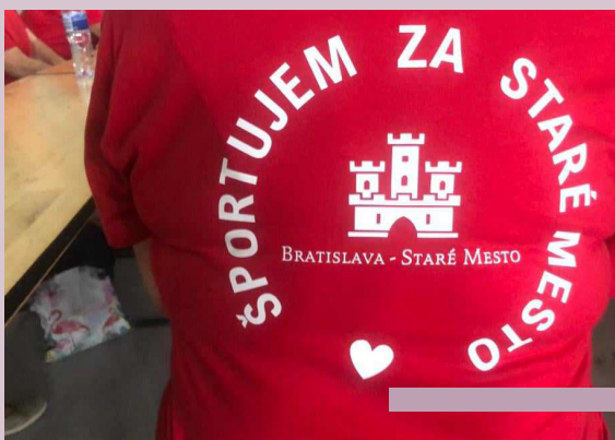
Reprezentačné tričko Starého Mesta