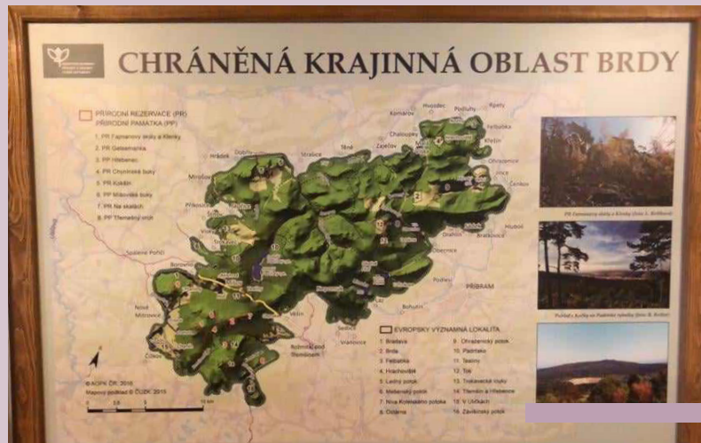
Hotel Brdy (vľavo), informačná mapa (vpravo)

Prvé poschodie je vyhradené pre príležitostné výstavy, ktoré sa konajú v priebehu roka. A celé druhé poschodie je venované stálej expozícii českej karikatúry, ktorej predstaviteľom bol Jiří Winter Neprakta. Je to jediná stála expozícia na svete.