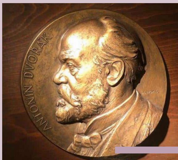
Pamätník A. Dvořáka a medaila s jeho portrétom