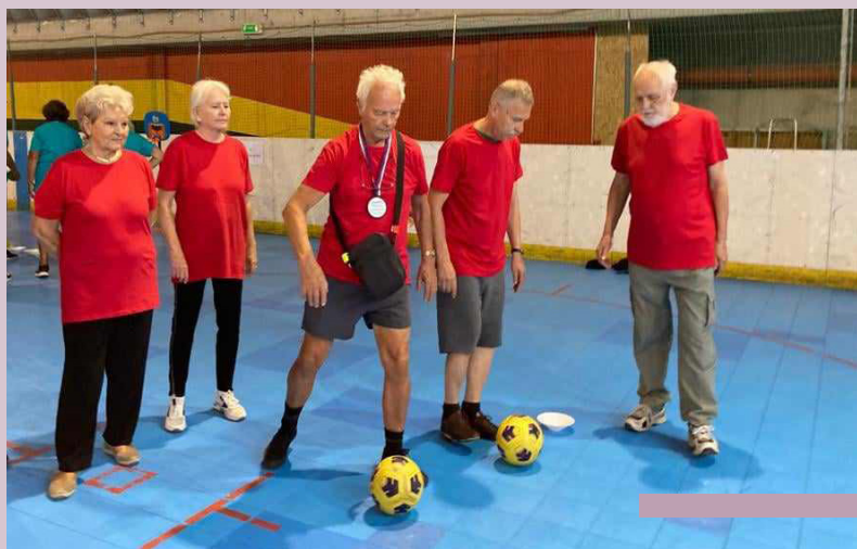
Reprezentanti Starého Mesta