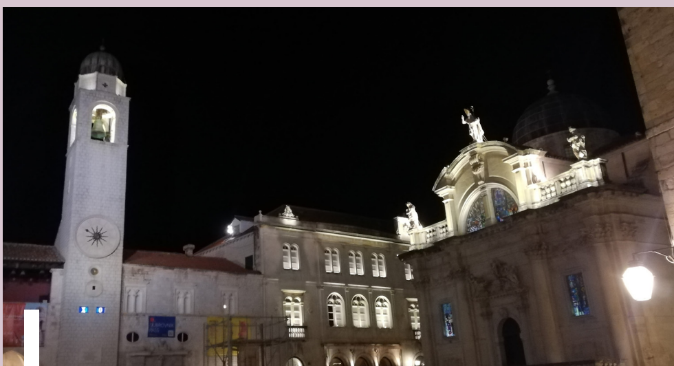
Čaro nočného Dubrovníka

Počiatky mesta siahajú do 7. storočia, kedy sa utečenci z okolia ukryli na skalu Laus a svoje sídlo nazvali Ragusa . Neskôr založili Slovania na hore Srđ osadu s názvom Dubrava . Časom obe sídla splynuli a postupne vytvorili slobodnú kupeckú republiku. Už koncom 10. storočia tu bolo založené dubrovničke arcibiskupstvo. Po dlhú dobu bol Dubrovnik pod protektorátom Byzancie, ale mal svoju autonómiu a úspešne sa rozvíjal. Neskôr sa mesto dostalo pod kontrolu Benátok, potom bolo súčasťou uhorsko-chorvátskej koruny aj Osmanskej ríše. Po celý čas však bola republika hospodársky viac-menej nezávislá, rozvíjala sa, mala svoju vlajku, erb i vojsko. Vrchol dosiahla v 16. storočí, keď disponovala jednou z najväčších obchodných flotíl na svete s konzulátmi vo viac ako 50 prístavoch. V druhej polovici 17. storočia začala moc Dubrovníka upadať. Začiatkom 19. storočia ho obsadili Francúzi a v roku 1808 Dubrovnička republika definitívne zanikla. Následne sa Dubrovnik dostal pod kontrolu Rakúsko-Uhorska a po jeho rozpade sa stal sú-