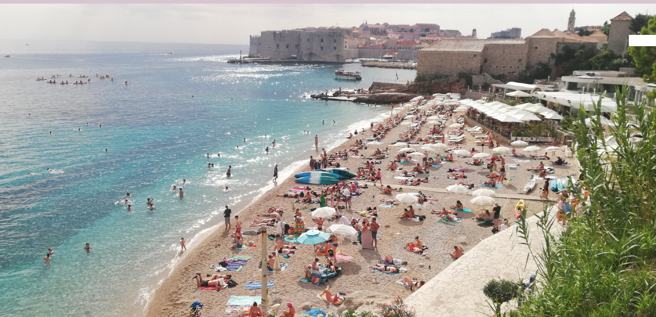
Pláž nedaleko starého mesta

Ďalším lákadlom Dubrovníka sú jeho pláže . Či už priamo pod hradbami, s výhľadom na ne, alebo v blízkom okolí. Všade je nádherné priehľadné more s tyrkysovou vodou ako z pohľadnice.