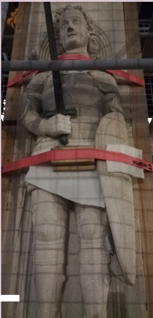
Palác Sponza a zvonica