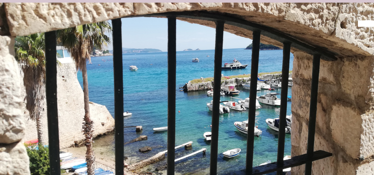
Pohľad cez zamrežované okno z nádvorja jednej z budov Lazareti