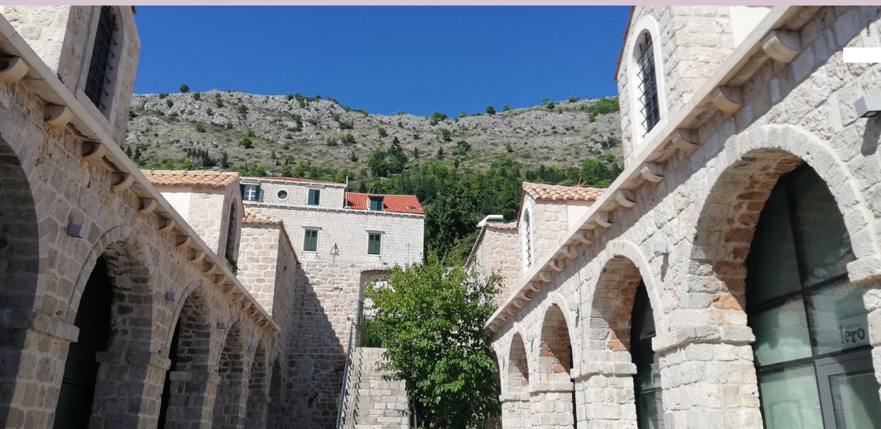
Lazareti, v budovách sú dnes kaviarne aj kultúrne stredisko