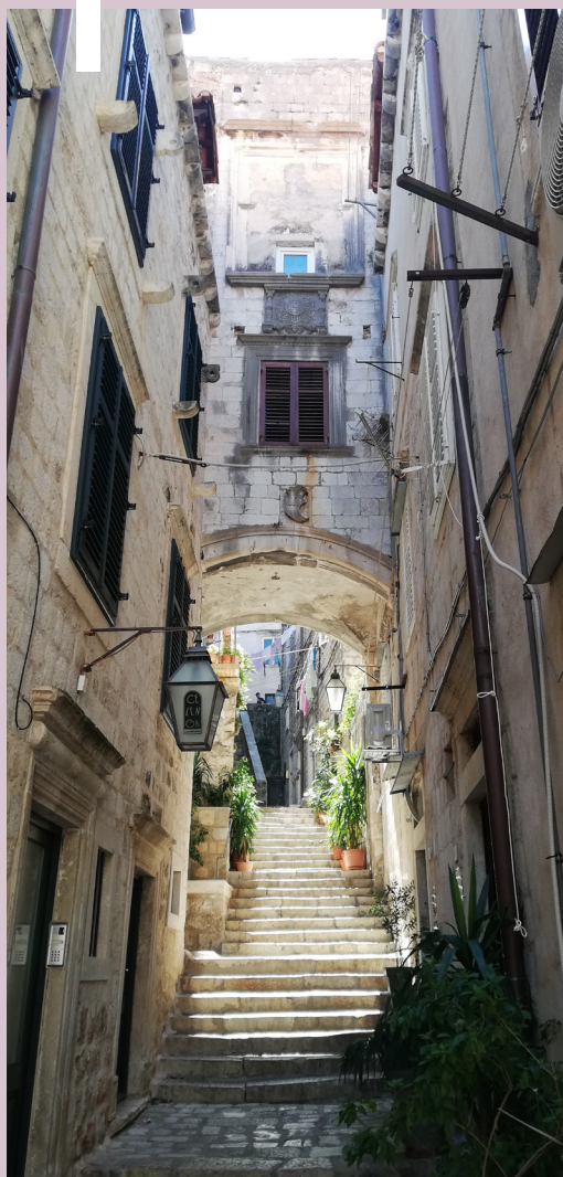
Červené strechy mesta Ulička Dubrovníka

Bohatá história sa odzrkadľuje v centre mesta, ktoré je zapísané v zozname Svetového dedičstva UNESCO. Je obohatené zachovalými mestskými hradbami s blízkym prístavom a obklopené nádherným Jadranským morom. Smotanovo biele budovy s červenými strechami, paláce, kostoly a úzke uličky s množstvom schodov vytvárajú jedinečnú atmosféru. Väčšina stavieb pochádza zo 14. až 15. storočia, no po ničivom zemetrasení v roku 1667 boli prestavané v barokovom štýle. Hradby , ktoré obklopujú staré mesto, sú vysoké až 25 metrov a ich hrúbka je od 1 do 6 metrov. Do opevneného mesta sa vstupuje tromi bránami z rôznych strán. Pri vstupe cez bránu Pile , ktorá má vo výklenku sochu patróna mesta,