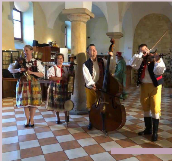
Zámok Spálené Poříčí (vľavo) a dudácka kapela (vpravo)

V priebehu týždňa sme navštívili mnohé galérie, hrady, zámky a precestovali sme veľkú časť plzenského kraja. Som veľmi rád, že som mal možnosť spoznať české vnútrozemie. Je to krásny hornatý kraj, ktorým sme denne jazdili luxusným turistickým autobusom. Všimol som si (a porovnával s našimi) napríklad cesty. Väčšinou sme jazdili po cestách 2. triedy, kde som nezacítil ani nespozoroval jediný výtlk. Všetky cesty tam majú perfektne, akoby čerstvo vyznačené okraje cesty i orientačnú stredovú čiaru. To mi u nás, na Slovensku, v mnohých prípadoch chýba. Všimol som si aj ako majú okolo ciest vysadené ovocné stromy, ktoré dnes žiaria úrodou jablák a hrušiek. V mnohých prípadoch je vidieť aj dosadené nové mladé stromy. Jednoducho vidieť, ako sa o cesty a ich okolie starajú a využívajú každý voľný priestor. Pamätám si, ako malý chlapec som chodil s rodičmi na pole, kde boli vedľa poľnej cesty vysadené čerešne. V období kolektivizácie a scelovania pozemkov sa všetko nemilosrdne zrušilo. Vznikli obrovské plantáže a na ovocie sa, jednoducho, zabudlo. Je to môj subjektívny pohľad a dúfam, že to tak nie je všade na Slovensku. Bohužiaľ tam, odkiaľ pochádzam, je to tak.