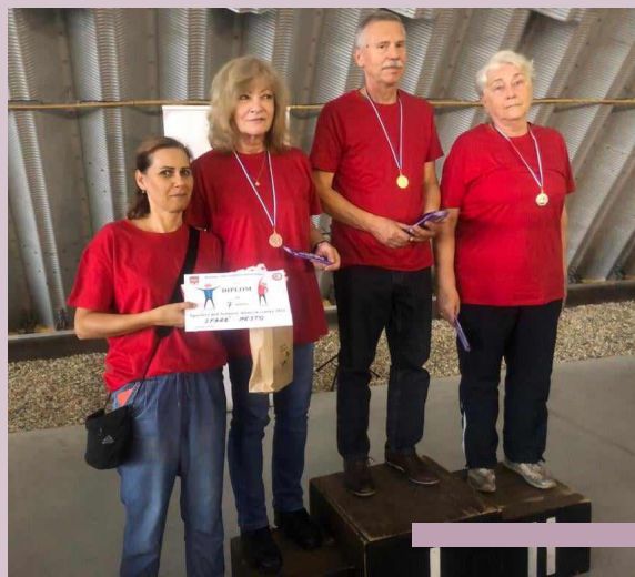
Vystúpenie žiačok ZUŠ Exnárova (vľavo) a výhercovia zo staromest- ského družstva