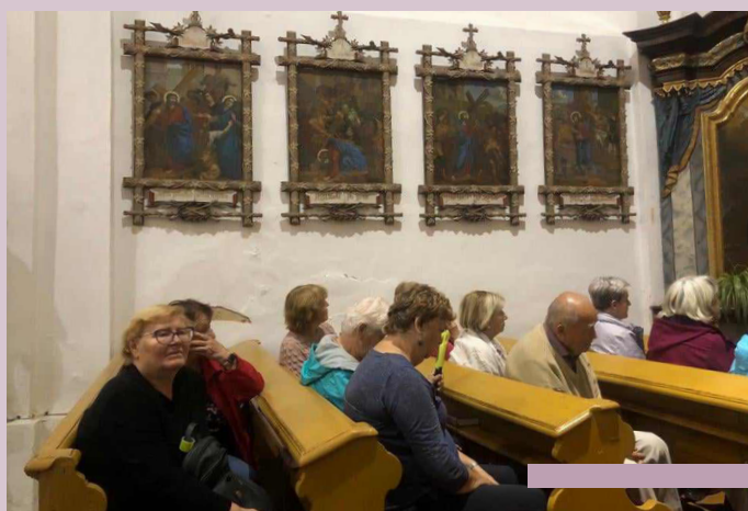
Organ J. J. Rybu (vľavo), priestory kláštora (vpravo)

Posledný večer pred odchodom nás čakalo prekvapenie od vedenia hotela – nočný tajný výlet. Nevedeli sme, čo nás čaká. Vo večerných hodinách sme autobusom navštívili v kláštore v mestečku Rožmitál pod Tremšínem, kde žil a tvoril veľký český hudobný skladateľ Jakub Jan Ryba. Čakala nás sprievodkyňa, ktorá podala odborný výklad zo života tohto veľkého umelca a predstavila nám históriu doby, v ktorej žil a tvoril.