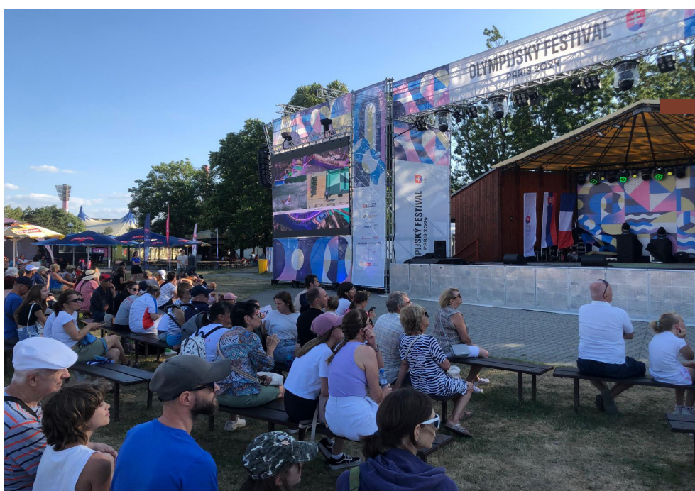
Hlavný stan a pódium Olympijského festivalu

Počas vodáckej súťaže v Paríži sa besedy v Bratislave zúčastnila i Elena Kaliská (vodný slalom), víťazka dvoch zlatých medailí. Počas besedy i po nej, pri autogramiáde, ju mladí diváci vôbec nešetrili a kládli jej rôzne otázky, na ktoré ťažko, ale s úsmevom odpovedala. Jej zlaté medaily všetkých potešili.