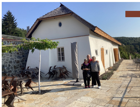
Vinice sv. Kláry

Pochodili sme časť botanickej záhrady, najmä 3,5 ha vinice s popisom druhov. Videli sme budovu vinotéky, vedľa ktorej zasadil asi v roku 2020 1 klč viniča francúzsky herec a vinár Pierre Richard. V tejto vinici vysadili vínnu révu aj herci Iva Janžurová a Václav Postránecký.