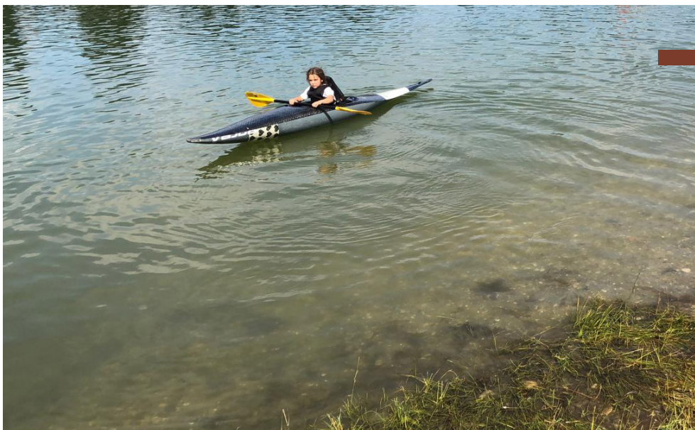
Detká jazda na kajakoch

Organizátori pozývali bývalých olympionikov a športových funkcionárov vždy, keď naši športovci štartovali v Paríži. Veľký záujem bol o tenis, kde sme sledovali ťažké zápasy našej reprezentantky Anny Karolíny Schmiedlovej. V deň, keď zápasila na olympiáde, bol na Kuchajde hosťom olympijský víťaz Miroslav Mečír. Vypočuli sme si dlhý rozhovor a zažili autogramiádu, kde ho dlho držala a spovedala naša mládež. Samozrejme obe zvládol s radosťou a s úsmevom. Takto to v športovom stredisku na bratislavskej Kuchajde prebiehalo počas celej olympiády. Bola radosť sledovať, aké množstvo záujemcov prichádza k športovému stredisku.