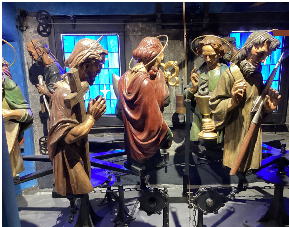
Apoštolí v interiéri orloja

Pozreli sme si, samozrejme, Pražský orloj na Staromestskej radnici, vyšli 42 m výtahom na vyhliadku aj osobitnú prehliadku zachovaných komnát radnice, apoštolov z orloja sme videli zvnútra budovy a prešli sme aj podzemie.