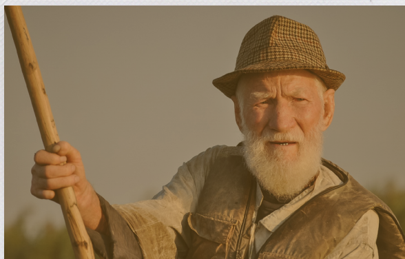
Poučenie: Starý rybár a kapor sa štučím manierom nenaucia.

To, čo mnohí mladší nechcú vidieť je fakt, že starší rybár si po sebe odnesie všetko, čo pri vode zanechal. Dokonca neváha odnieť aj veci po iných. Vadí im aj to, že starší zaúčajú vnukov do tajov rybačky. Vidia v nich iba svojich budúcich susedov, ktorí im zaberú vyárendované fleky pre seba a svoje mašiny.