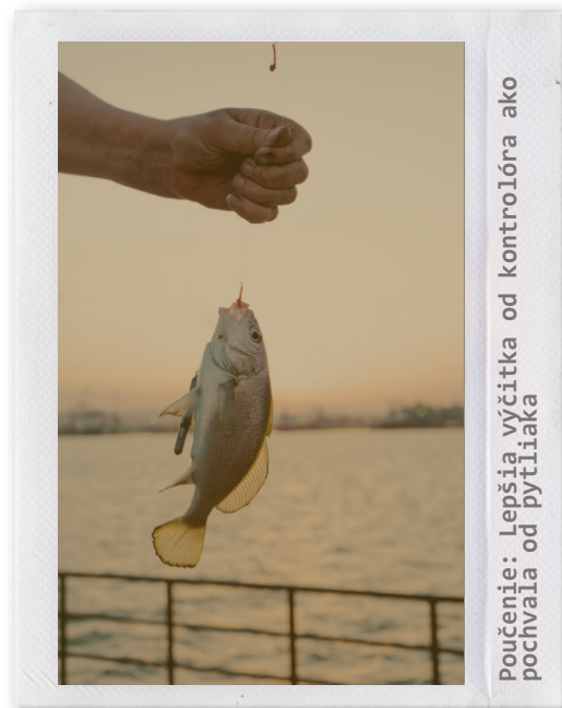
Poučenie: Lepšia výčitka od kontrolóra ako pochvala od pytlíaka

Takáto rybačka, hoci s peknými úlovkami, nestojí za nič. Rybár odchádza znechutene nad nezmyselnou vyhláškou, kontrolór s údivom analyzuje použité výhovorky nespratných rybárov. Na škodu oboch. Lov rýb by mal prinášať iba pohodu a pokoj v duši.