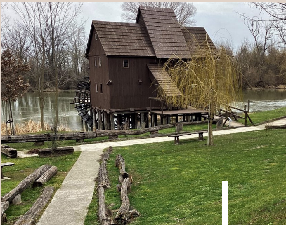
Vodný mlyn pri Jelke