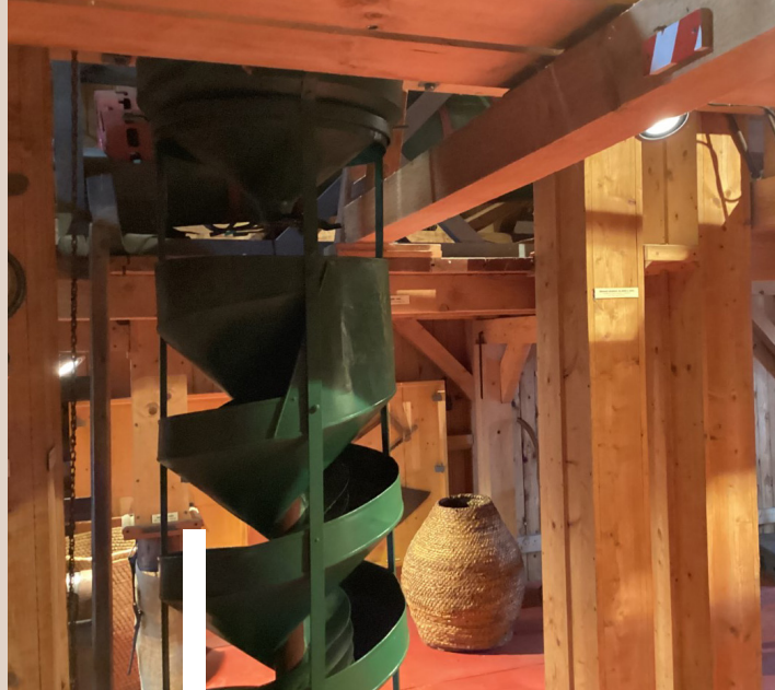
Interiér vodného mlyna