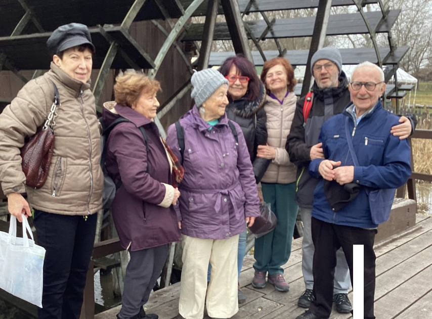
Výletníci v Jelke