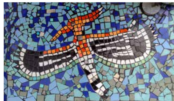
Vue de la Huppe fasciée, mosaïque, Moulin neuf, Gétigné, juillet 2022.

LES PLANS et CROQUIS sont compris dans le projet et sont évolutifs. Ils peuvent prendre la forme d'un tableau, d'une frise, d'une suite de tableaux ou d'une zone définie au sol ou au mur.