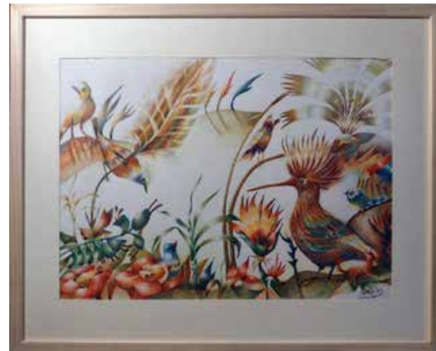
Amadès, Nature-Peinture II, crayons de couleurs, 2022.

LES PLANS et CROQUIS sont compris dans le projet et sont évolutifs. Ils peuvent prendre la forme d'un tableau, d'une frise, d'une suite de tableaux ou d'une zone définie au sol ou au mur.