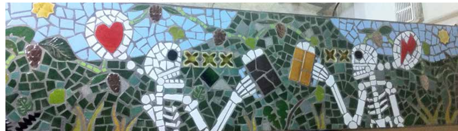
Bambi, vues du comptoir de mosaïque et céramique, «Drunken», Montreuil-Paris, 2016.