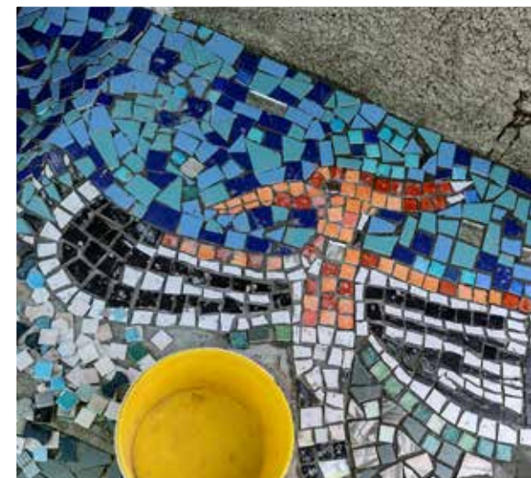
Vue de la huppe fasciée en construction, chantier mosaïque, juillet 2022, site du Moulin neuf, Gétigné.