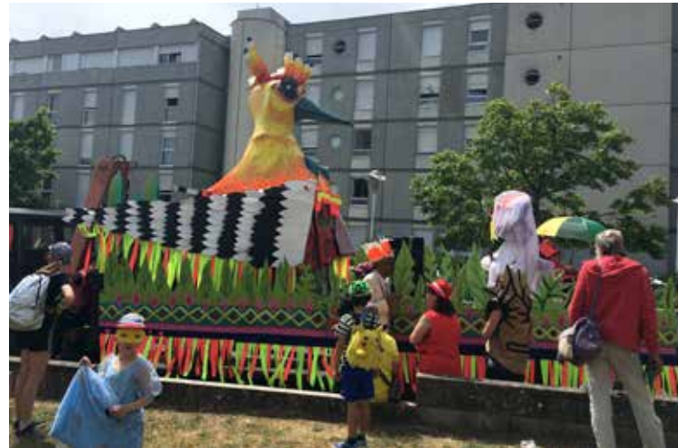
Bambi, Huppe fasciée, papier mâché, acrylique, réalisé dans le cadre du projet «carnaval de Quai des Chaps», en partenariat avec la ville de Nantes, mai 2022. (avec la participation d'Amadès)

Exemples illustrés de thématique commune entre les artistes : la huppe fasciée, en tant que symbole du mouvement, est un oiseau migrateur traversant la région des Pays de la Loire.