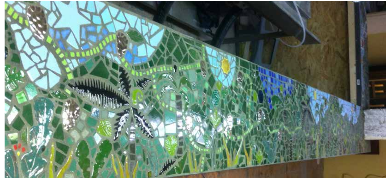
Bambi, vues d'un comptoir en mosaïque et céramique, au «Drunken», Montreuil-Paris, 2016.