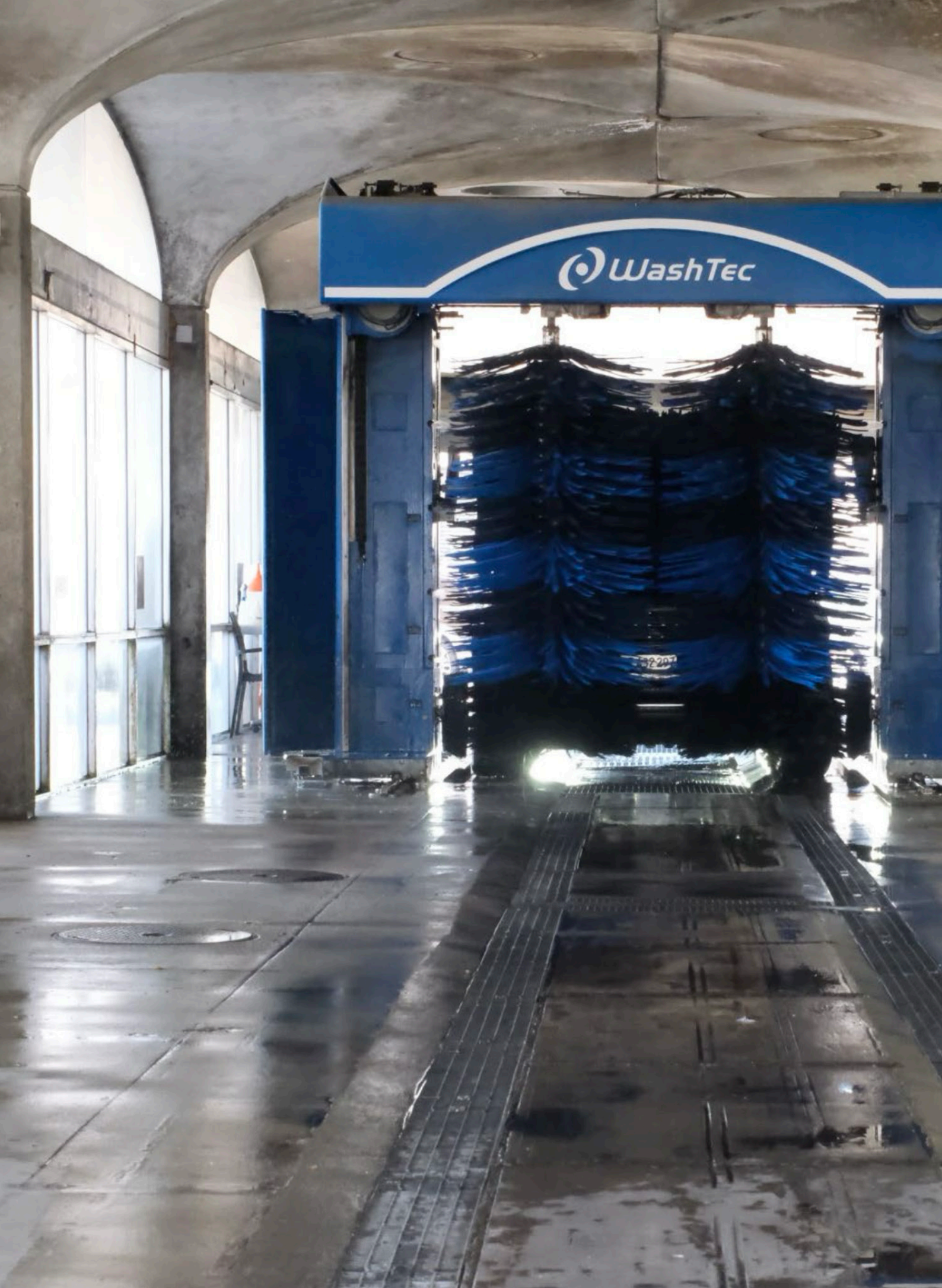
Praille - Acacias - Vernets / Fragment urbain, 2025.