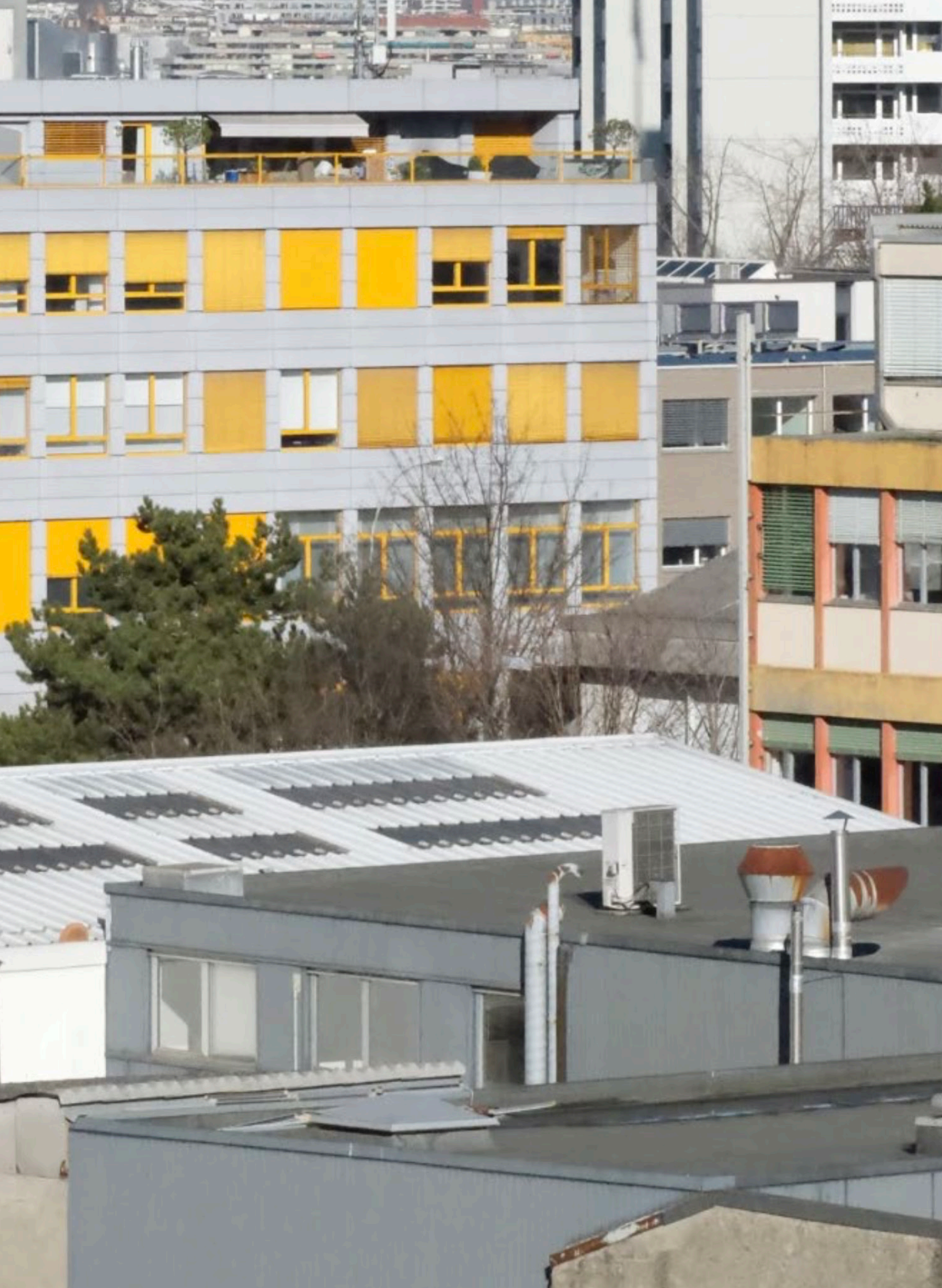
Praille - Acacias - Vernets / Fragment urbain, 2025. © association PAV living room