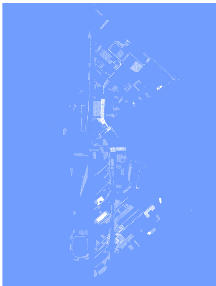
Midnight Spaces, PAV living room 02, 2024

● Pour cette troisième édition, PAV living room poursuit son exploration des figures spatio-temporelles du