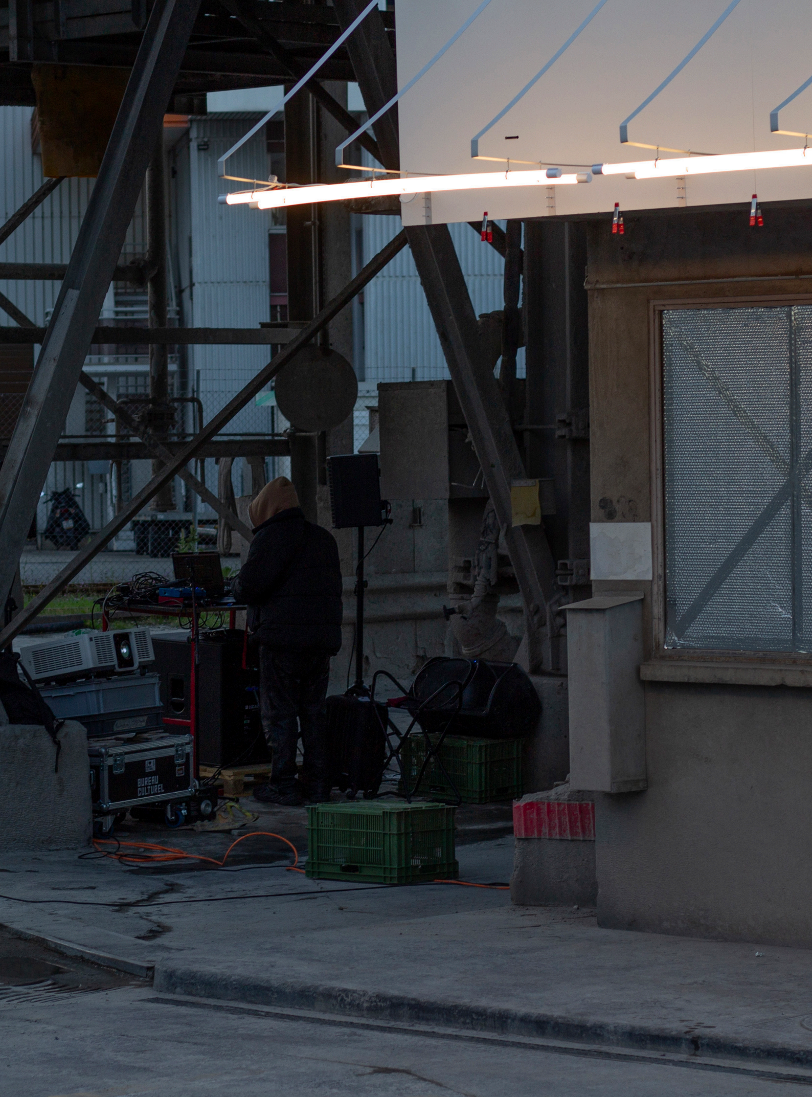
Alimentation Générale Studio, L'appel du néon , et Chaos Clay x Joyfully Waiting x Motel Campo, GodxChange , 2024. Dans le cadre de Midnight Spaces , PAV living room éd. 02 x Mosaïque Urbaine , Ville de Lancy.