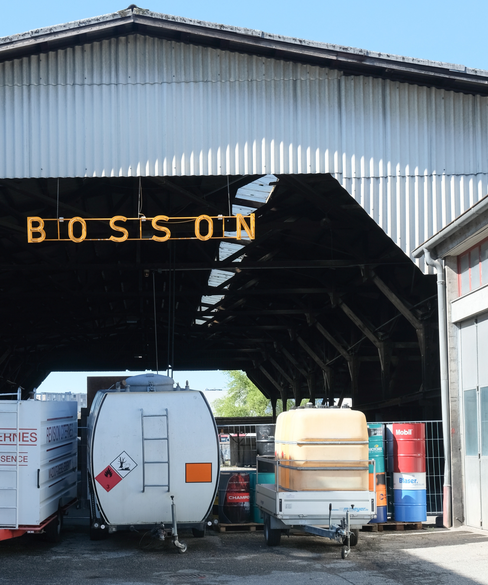
Praille - Acacias - Vernets / Fragment urbain, 2025.