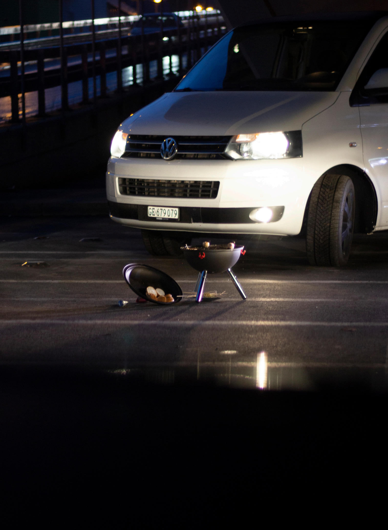
Sujets Objets /, Drive In , 2023. Dans le cadre de PAV living room éd. 01. © Camille Wetzel