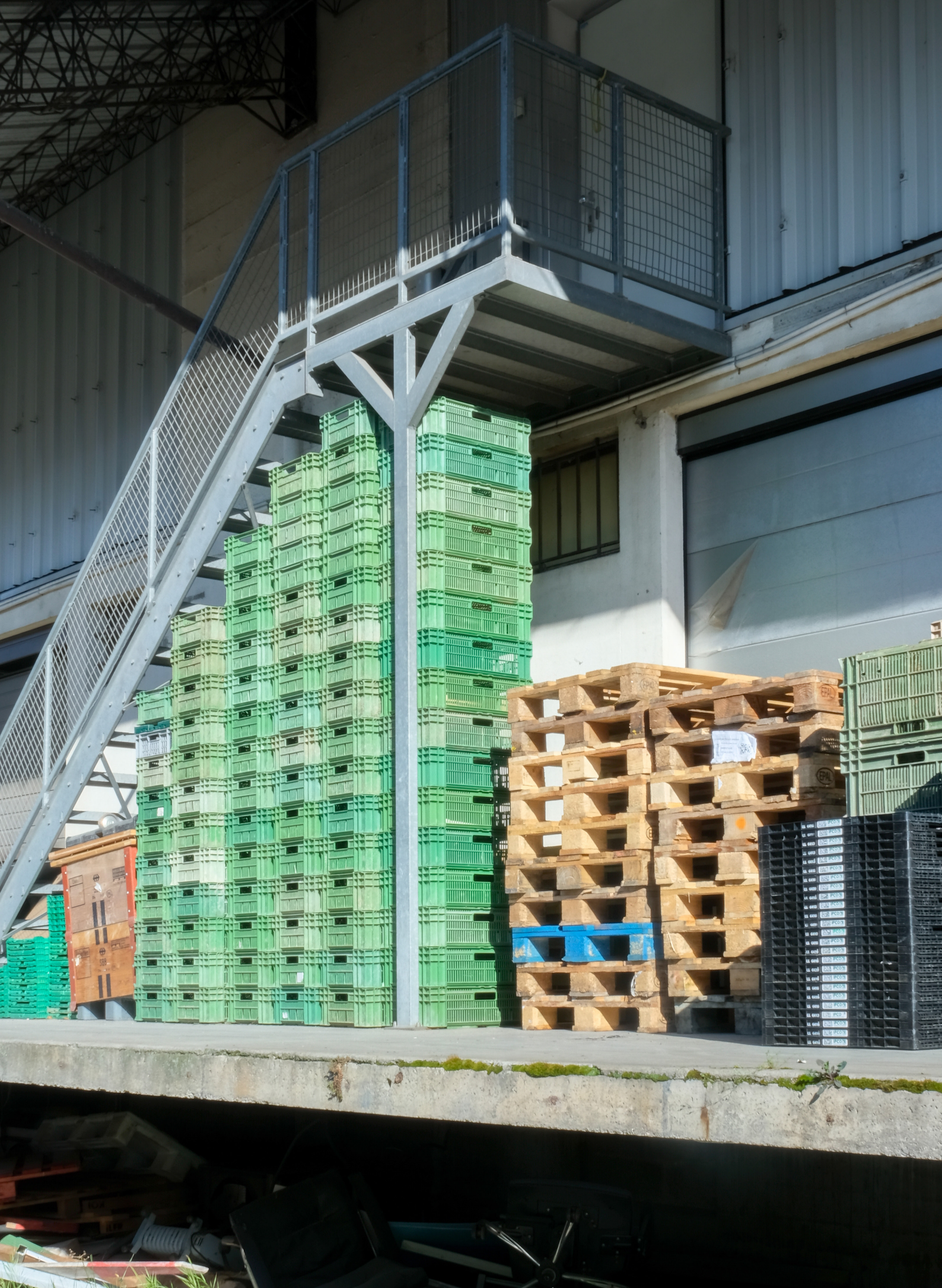
Praille - Acacias - Vernets / Fragment urbain, 2025.