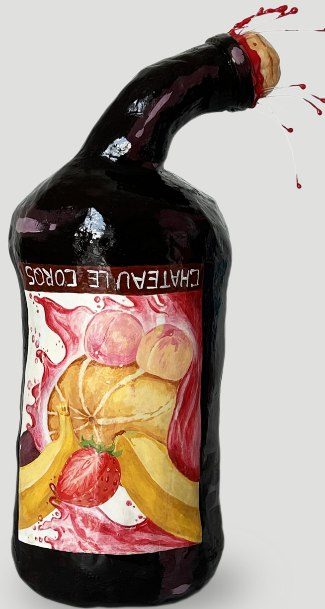
CHATEAU LE CORQS