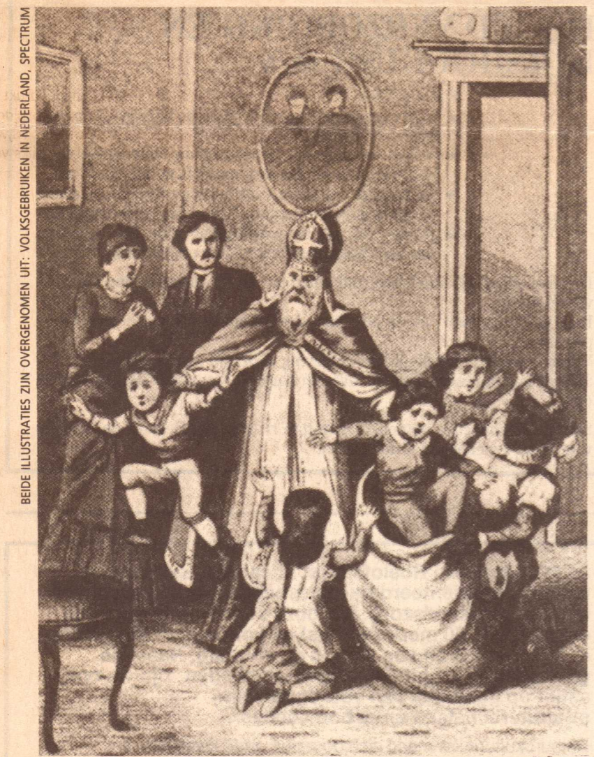
ILLUSTRATIE UIT 'SINT NICOLAAS EN ZIJN KNECHT', DOOR J. SCHENKMAN, EIND NEGENTIENDE EEUW. COLLECTIE NEDERLANDS OPENLUCHT MUSEUM, ARNHEM