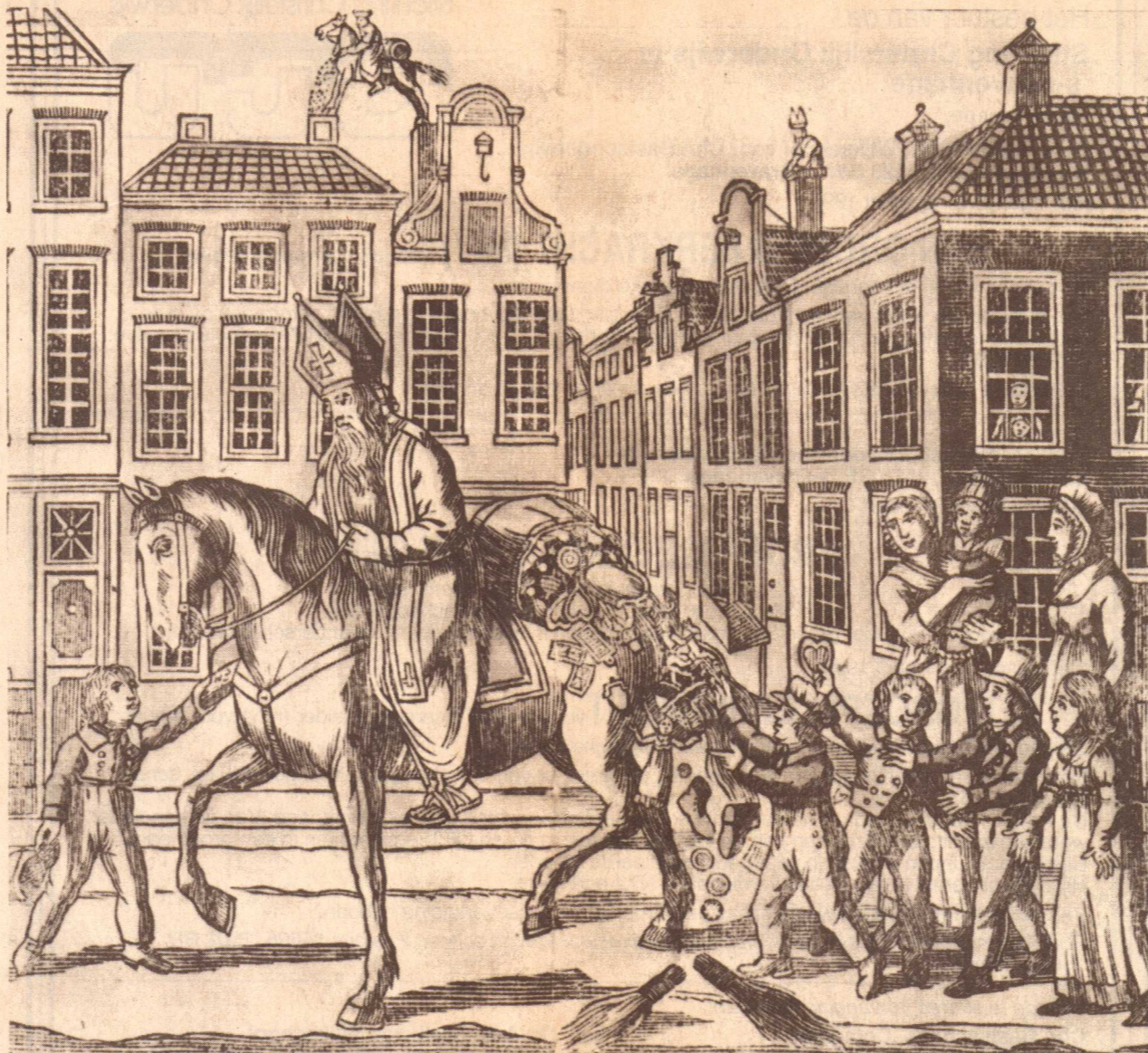
PRENT UIT HET BEGIN VAN DE 18DE EEUW, TOEN HET NOG GEBRUIKELIJK WAS OM VERSCHILLENDE EPISODEN - HIER DE INTOCHT EN DE RIT OP DE DAKEN - IN EEN VOORSTELLING OP TE NEMEN. ER IS DUS GEEN SPRAKE VAN MEERDERE SINTERKLAZEN!

Iedereen weet dat Sinterklaas al heel oud is. Dat leren wij als kind. Toch zijn er maar weinig mensen die weten wat Sinterklaas in zijn lange leven allemaal heeft meegemaakt. Zo is hij ooit eens in een gerechtelijk proces verkwild geweest. Een oude legende wil, dat hij werd aangeklaagd wegens het bederven van de jeugd. Onmaatschappelijk gedrag en bederf van de jeugd door vrijgevigheid, luidde de officiële aanklacht.