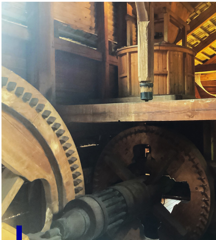
Lodný mlyn Kolárovo Múzeum vodného mlynárstva