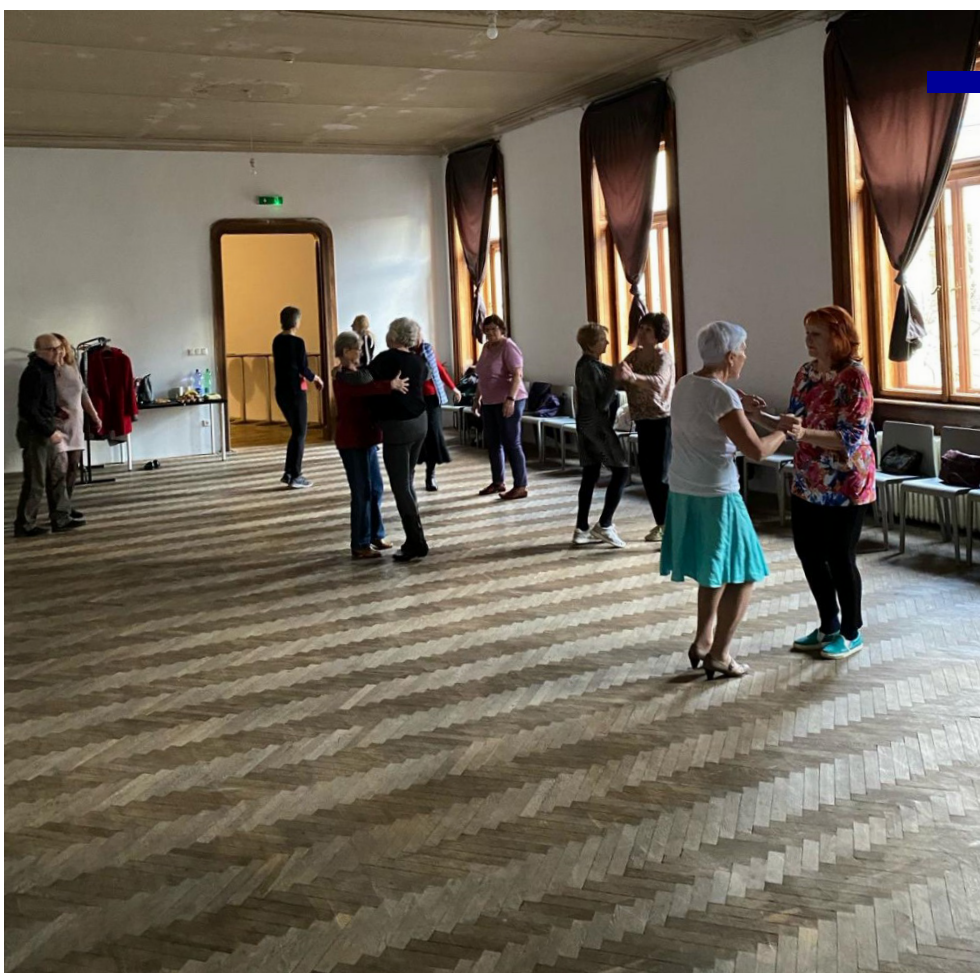
Tančiareň v Pistoriho paláci