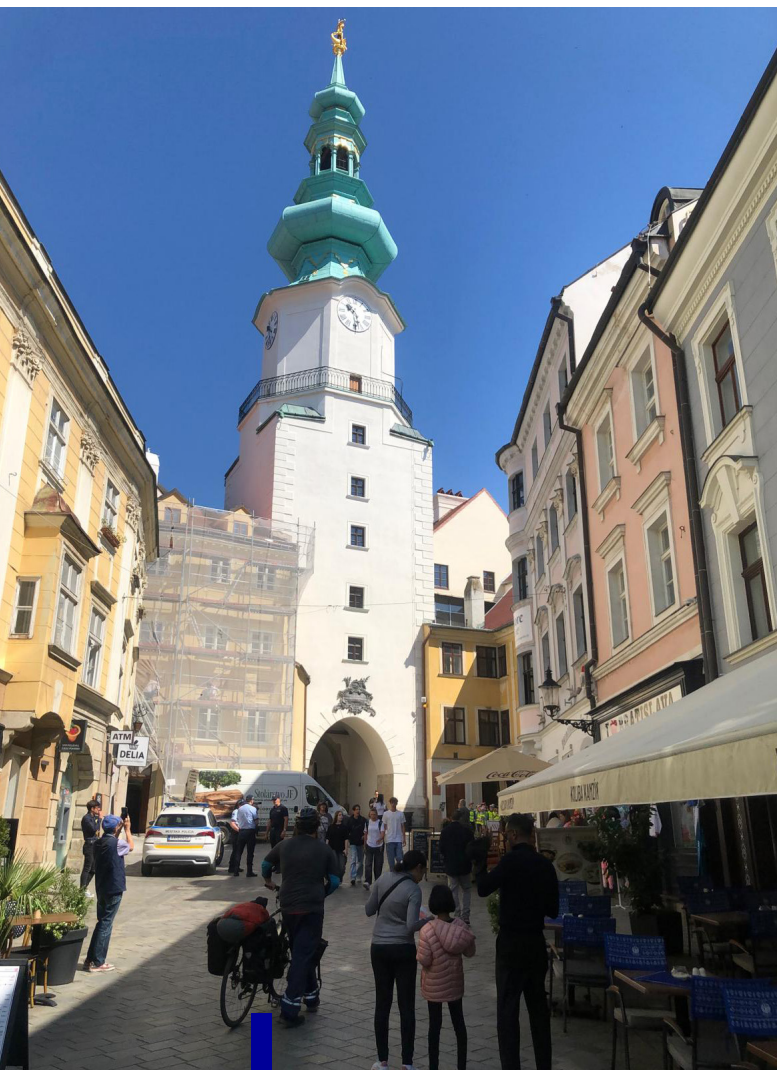
Michalská veža v susedstve (vľavo); roh Zámočnickej a Františkánskej ulice (vpravo)