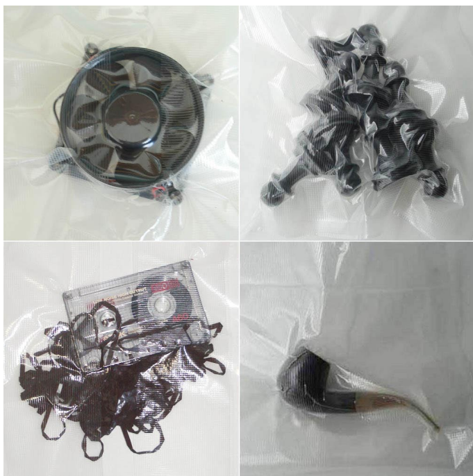
CLAUDIO TRINDADE Vacuos / Vacuums (Objetos / Objects)