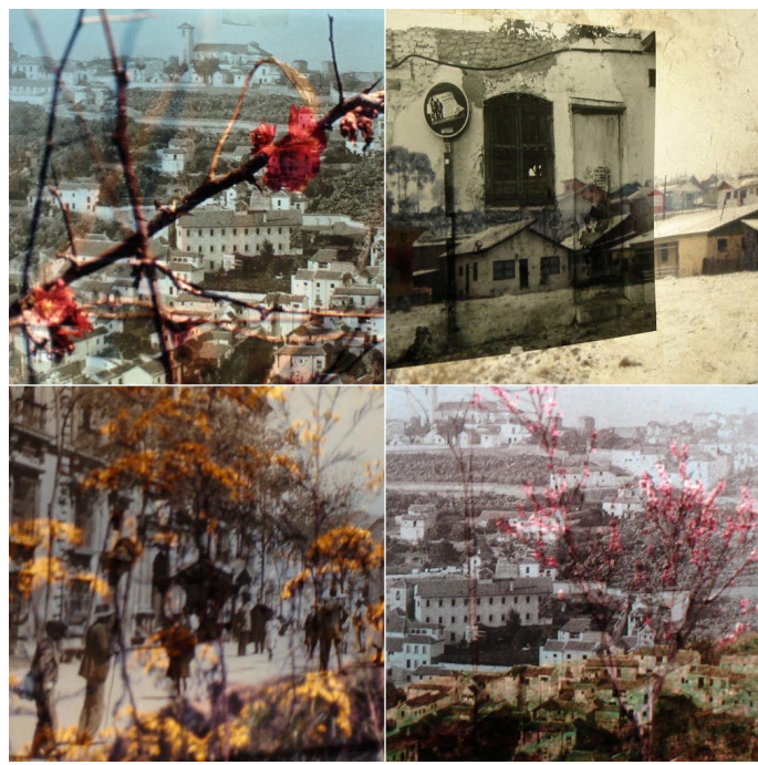
LELA MARTORANO Deslumbramientos / Dazzle (Fotografía / Photograph)