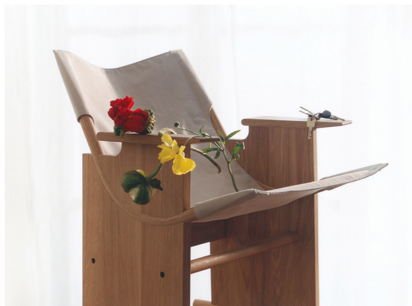
En haut, bureau-bibliothèque Rampa, en chêne fumé, design Achille et Pier Giacomo Castiglioni, KARAKTER . Lampe Totem Styx, en céramique, VILLA AREV . Tapis Segni Minimi 3, laine de l'Himalaya, tissé à la main, design Giuseppe Di Costanzo, CC-TAPIS . En bas, fauteuil Sling Lounge Chair, structure en chêne massif, assise en lin bio, TAKT .