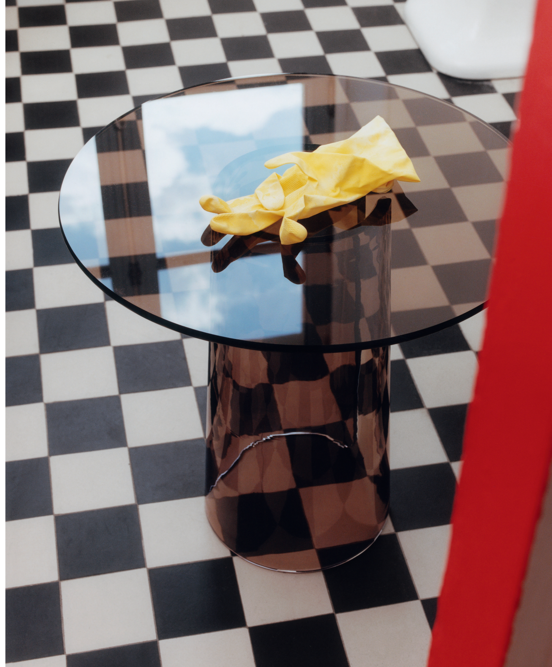
Page de droite, table Orbit, structure et plateau en verre bronze, design Jean-Marie Massaud, POLIFORM CHEZ SILVERA .