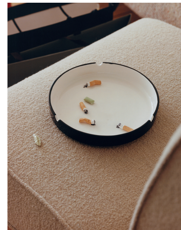
Ci-dessus, cendrier Mégots, en céramique, VILLA AREV .

Daybed Sévigné, structure multipli et renforts en hêtre, design Studio Parisien, THE INVISIBLE COLLECTION . Lampadaire Hood, abat-jour en verre fumé, socle et structure en acier, design Andreas Kowalewski, LIGNE ROSET .