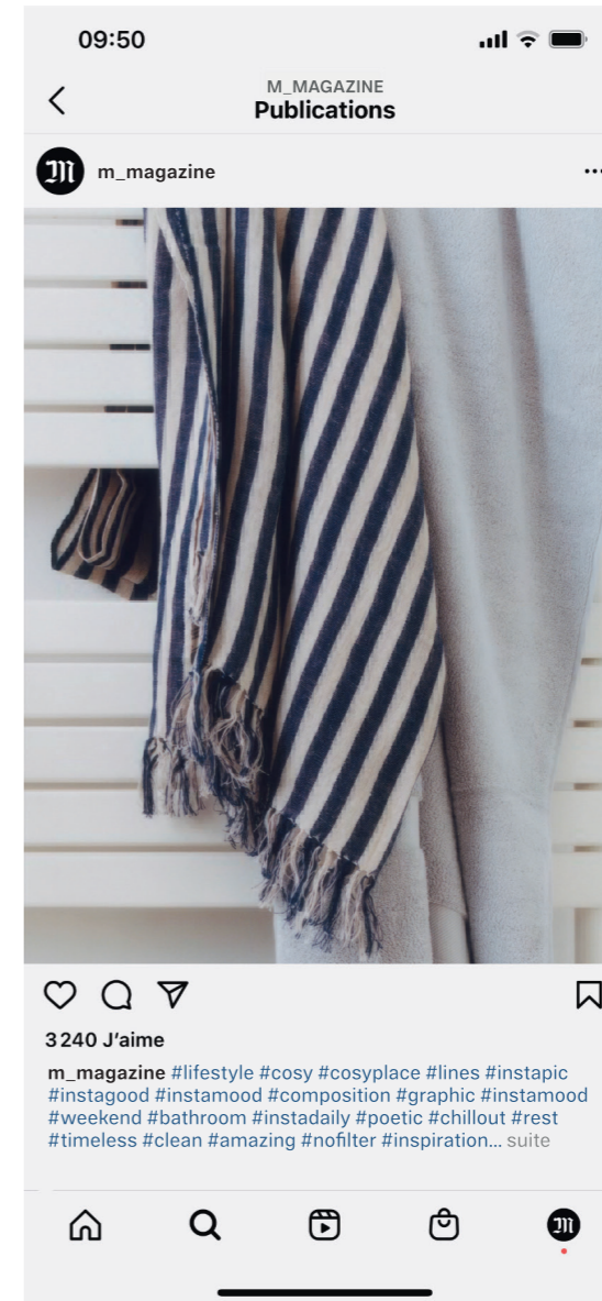
Plaid en lin et serviettes de bain en coton, THE CONRAN SHOP .