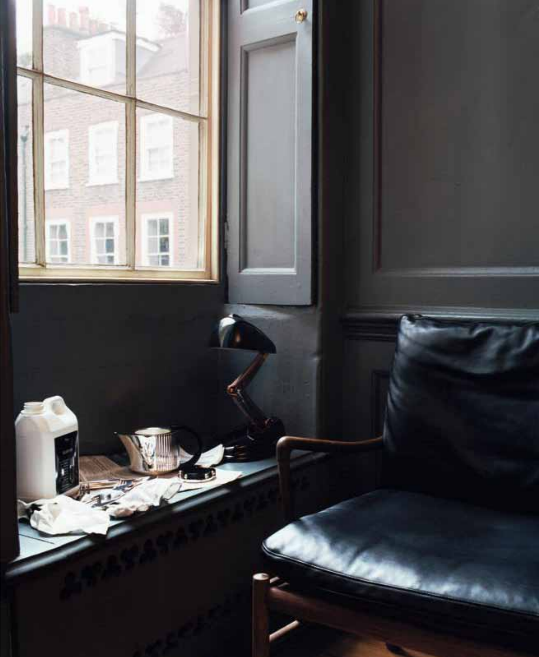
PAGE DE DROITE, CANAPÉ COLONIAL OW149-2, STRUCTURE EN NOYER HUILÉ, ASSISE ET DOSSIER EN CUIR LISSE SIF 98, DESIGN OLE WANSCHER, RÉÉDITION CARL HANSEN & SØN, THE CONRAN SHOP. LAMPE JUMO CLAS- SIQUE EN BAKÉLITE NOIRE, MERCI, THÉIÈRE ET CHEA ART DÉCO 1937 EN MÉTAL ARGENTE ET ANSES EN BOIS DE PALISSANDRE, ET COUVERTS DEAUVILLE EN ARGENT MASSIF, PUIFORCAT.