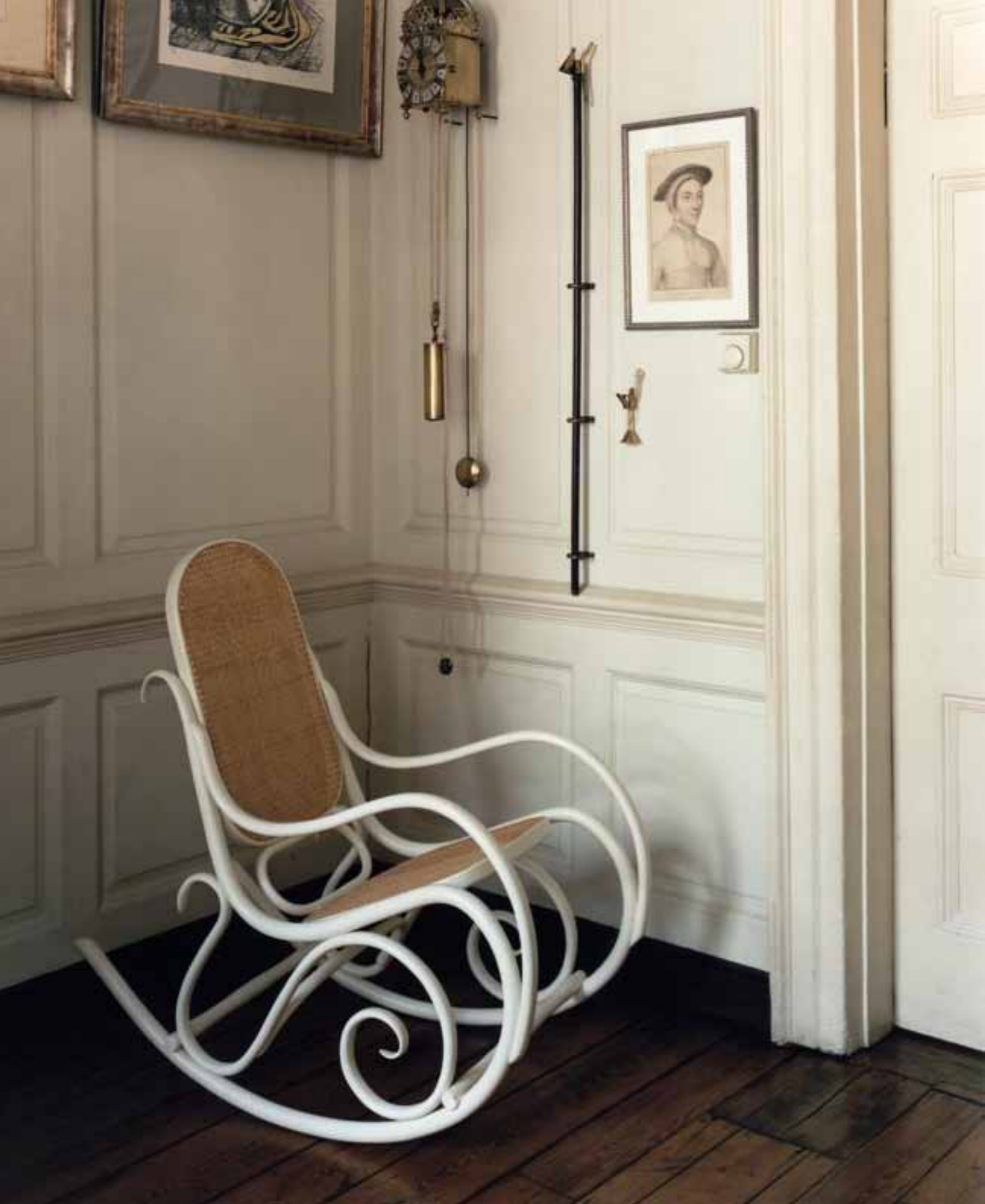
PAGE DE GAUCHE, CHAISE À BASCULE SCHAUKESTUHL LAQUÉE BLANCHE, AVEC STRUCTURE EN HÊTRE MASSIF COURBÉ À LA VAPEUR, ASSISE ET DOSSIER EN PAILLE DE VIENNE, GEBRÜDER THONET VIENNA GMBH.