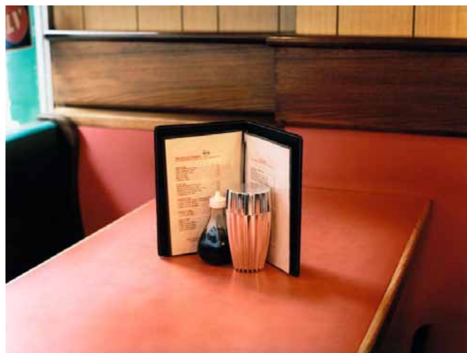
CI-CONTRE, MOULIN À POIVRE GRIND, DESIGN WILLIAM ALSOP ET FEDERICO GRAZZINI, ALESSI.