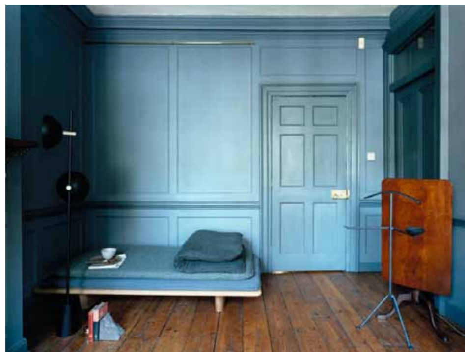
EN BAS, LAMPE SUR PIED STUDIO LAMP EN ACIER ET LAITON, DESIGN LAURA BILDE, ÉDITION HANDVÅRK CHEZ NORDKRAFT. SERRE-LIVRES CALVIN & HOBBS, MARBRE TALA ET SPHÈRE EN ACIER POLI, STEPHANIE MOUSSA- LEM DESIGN STUDIO, AU BON MARCHÉ RIVE GAUCHE. BANQUETTE LAYLOW COMPOSÉE D'UNE BASE EN CHÊNE ET DE 3 MATELAS EN LATEX NATUREL À SUPERPOSER, DESIGN RAPHAËL NAVOT, ÉDI- TION RUE HÉROLD, BOL ET ASSIETTE EN GRÈS, RÉALISÉS À LA MAIN, CÉCILE PREZIOSA. VALET DE NUIT OFFI- CINA STRUCTURE EN FER FORGÉ VERNI ET ÉLÉMENTS EN SILICONE, DESIGN RONAN ET ERWAN BOUROULLEC, MAGIS CHEZ ÉDIFICE.