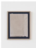
6 · SIMPLE STRUCTURES I (Initial Studies) (2022-24) Acrylgrundierungen und -farben, Nähgarn auf Naturstoff 28 x 34 cm | 11 x 13.4 in