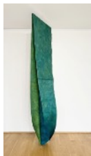
5 · DEEP FEELINGS, BIG DREAMS (2024) Acrylgrundierungen und -farben, Nähgarn auf Naturstoff 75 x 270 x 45 cm | 29.5 x 106.3 x 17.7 in