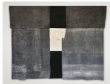
2 · MEN ARE MADE FOR WAR (2024) Acrylgrundierungen und -farben, Naturpigmente und Nähadeln auf Naturstoff 350 x 285 cm | 137.8 x 112.2 in