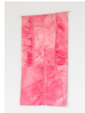
9 · ALL THE THINGS LEFT UNSAID (2024) Acrylgrundierungen und -farben, Nähgarn auf Naturstoff 62 x 100 cm | 24.4 x 39.4 in