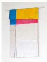
3 · PINK IS FOR GIRLS (2024) Acrylgrundierungen und -farben, natürliche Pigmente und Nähgarn auf Baumwollleinwand 130 x 165 cm | 51.2 x 65 in