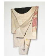
11 · COURAGE NOT TO FIGHT (2024) Acrylgrundierungen und -farben, Nähgarn auf Naturstoff 120 x 160 cm | 47.2 x 63 in