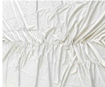
4 · DOLLHOUSE (2024) Nähgarn auf Naturstoff 750 x 280 cm | 295.3 x 110.2 in