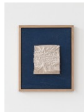
12 · SIMPLE STRUCTURES II (Initial Studies) (2022-24) Acrylgrundierungen und -farben, Nähgarn auf Naturstoff 25 x 30 cm | 9.8 x 11.8 in