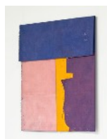
7 · NEW MASCULINITY (2024) Acrylgrundierungen und -farben, natürliche Pigmente auf synthetischem Gewebe 85 x 95 cm | 33.5 x 37.4 in