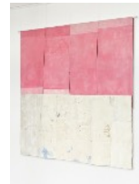
8 · HORSES MADE OF STICKS (2024) Acrylgrundierungen und -farben, Nähgarn auf Naturstoff 233 x 193 cm | 91.7 x 76 in