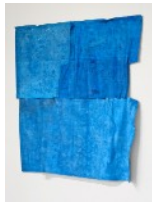
1 · HIDDEN STRUCTURES (2024) Acrylgrundierungen und -farben, Nähgarn auf Naturstoff 180 x 160 cm | 70.9 x 63 in