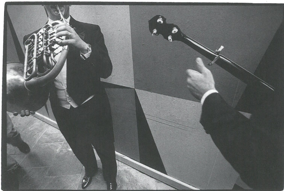
Estival Jazz Lugano 1998