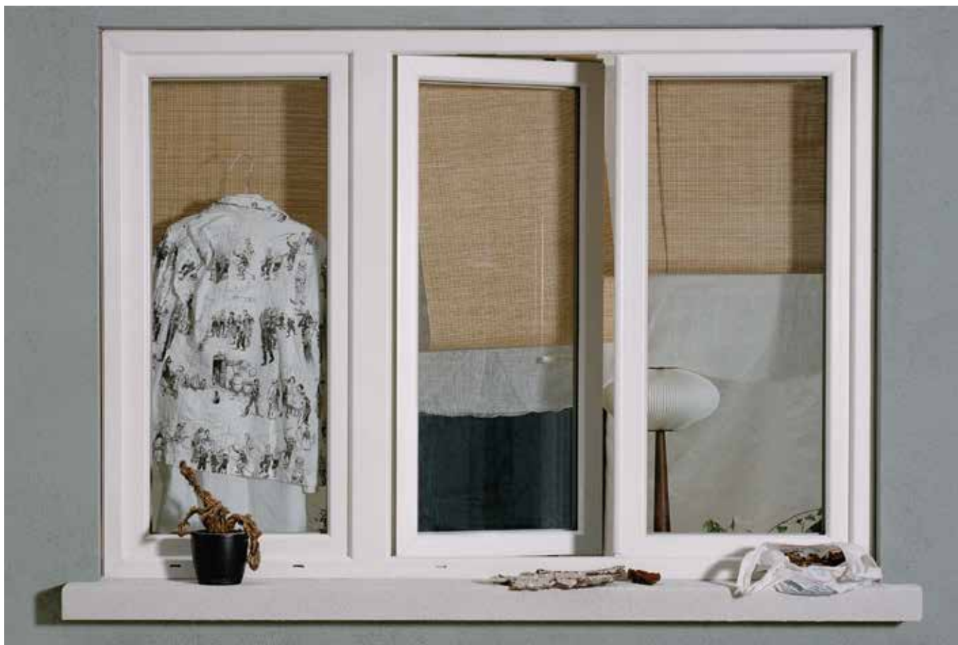
Chemise, PAUL HARDEN CHEZ L'ÉCLAIREUR.