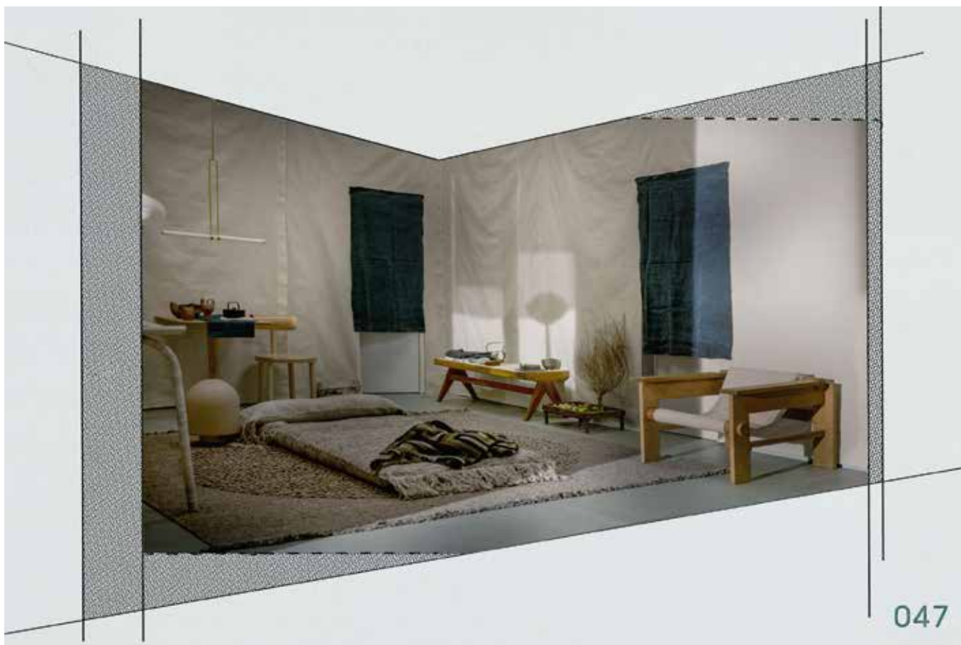
Fauteuil Armchair (vue plan), en chêne et lin, HAOS.