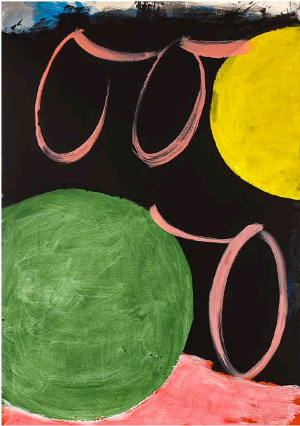
Oh, no, 2021, 190 x 130 cm, textielverf, zwarte gesso en acrylverf op doek.

van de realiteit. Ze werkt echter evenmin moedwillig ontoegankelijk, non-figuratief of abstract. Eerder lijkt ze de realiteit te zien als een uitdaging om er associatief en creatief mee aan de haal te gaan. Ze beschrijft haar werk zelf dan ook als het werken op een 'plaats delict': ze focust in op elementen en fragmenten uit de realiteit en legt op een zoekende wijze verbanden. Uit de zo ontstane schilderijen borduurt ze vaak weer verder in volgende werken. Wie haar oeuvre overziet, kan zich dan ook niet onttrekken aan de indruk van een 'thema met variaties', een reeks Ovidiaanse 'metamorfoses' of aan een 'Gesamtkunstwerk' met vaste 'Leitmotive'.