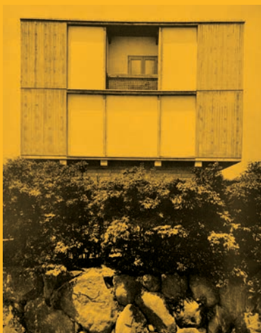
Maekawa Yoshimura Sakakura International House of Japan 1955