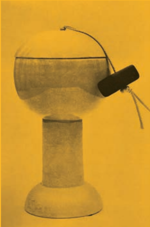
Ettore Sottsass Vase 1956