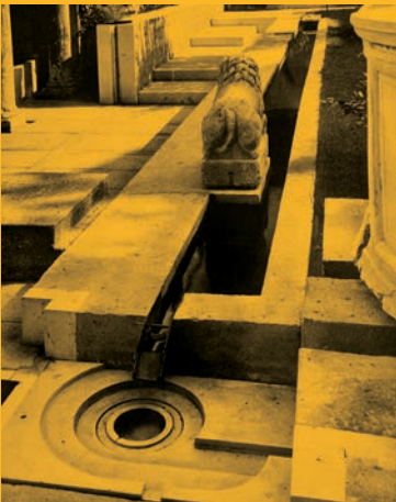
Carlo Scarpa Fondazione Querini Stampalia 1961