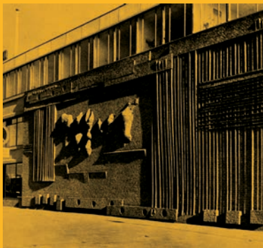
Henry Moore Bouwcentrum wall 1955