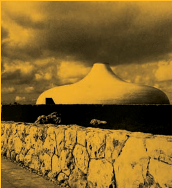
Frederick Kiesler Shrine Of The Book 1965