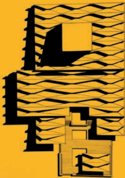
Jörn Utzon Project for the Zurich Theatre 1964