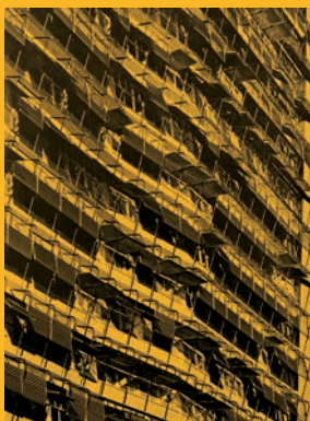
Marcelo and Mauricio Roberto Apartment building in Rio De Janeiro 1956