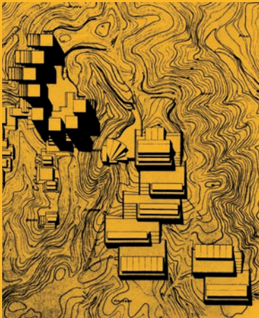
Jörn Utzon Competition scheme for Elviria 1960