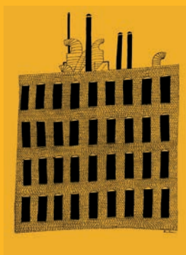
Ben Shahn 1961