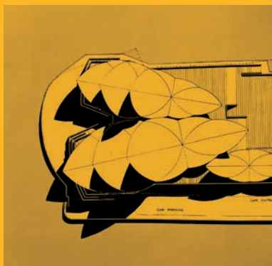
Jörn Utzon Sydney Opera House 1959-1973