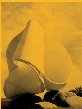
Max Bill Kontinuität 1947