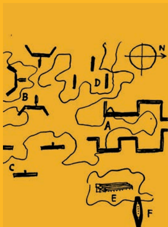
Le Corbusier Volumes bâtis pour l'habitation 1960