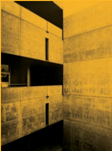
Louis Kahn Salk Institute For Biological Studies 1965