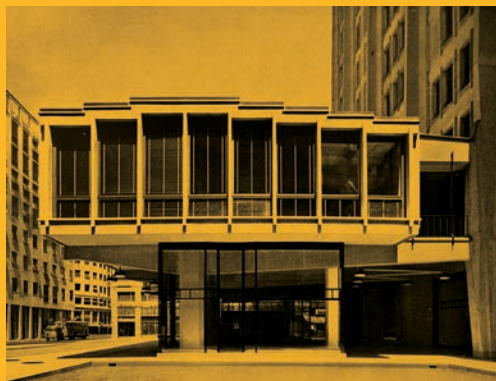
BBPR Torre Velasca 1954-1958