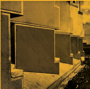
James Stirling St. Andrews University 1968