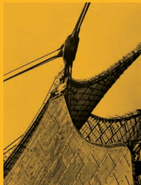
Frei Otto Munich Olympic Games 1967

Director: Renzo Zorzi Chief Editor: Maria Bottero Editor: Paolo Nepoti Cover: Umberto Riva Layout: Italo Lupi Publisher: Edizioni di Comunità, under the auspices of Ing. C. Olivetti & C., Ivrea