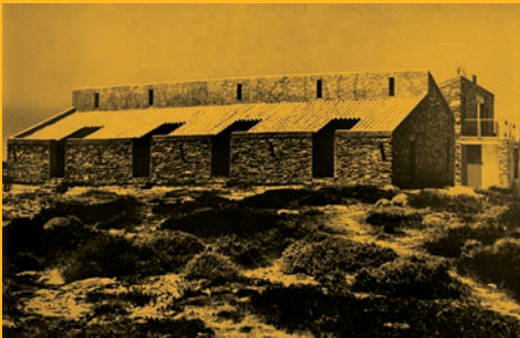
Umberto Riva Casa a Stintino 1959-60