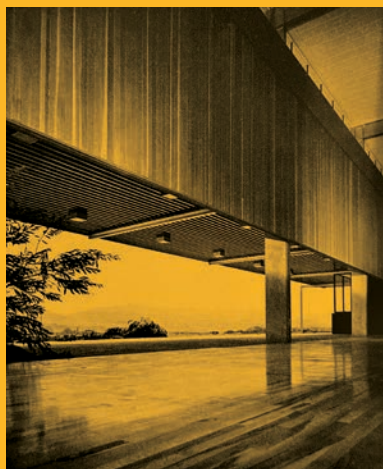
Richard Neutra Eagle Rock Park Playhouse 1955