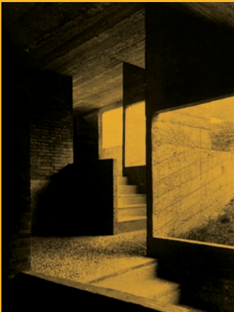
Giancarlo De Carlo University College in Urbino 1962-1983