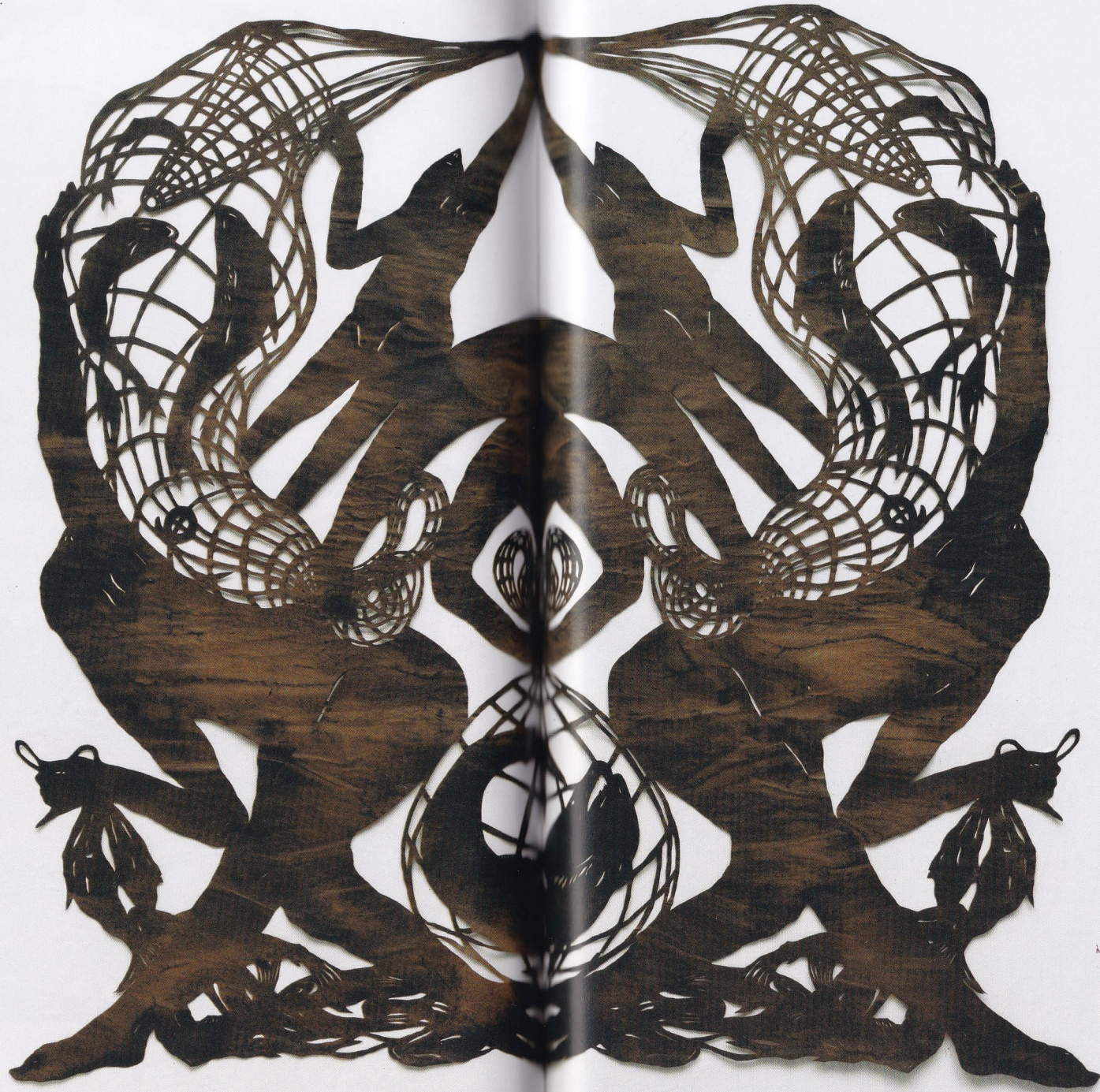
JULIA GALLO, "Segundo milagre dos peixes", 2023. Manquim e café sobre papel recortado. 176 x 173 cm