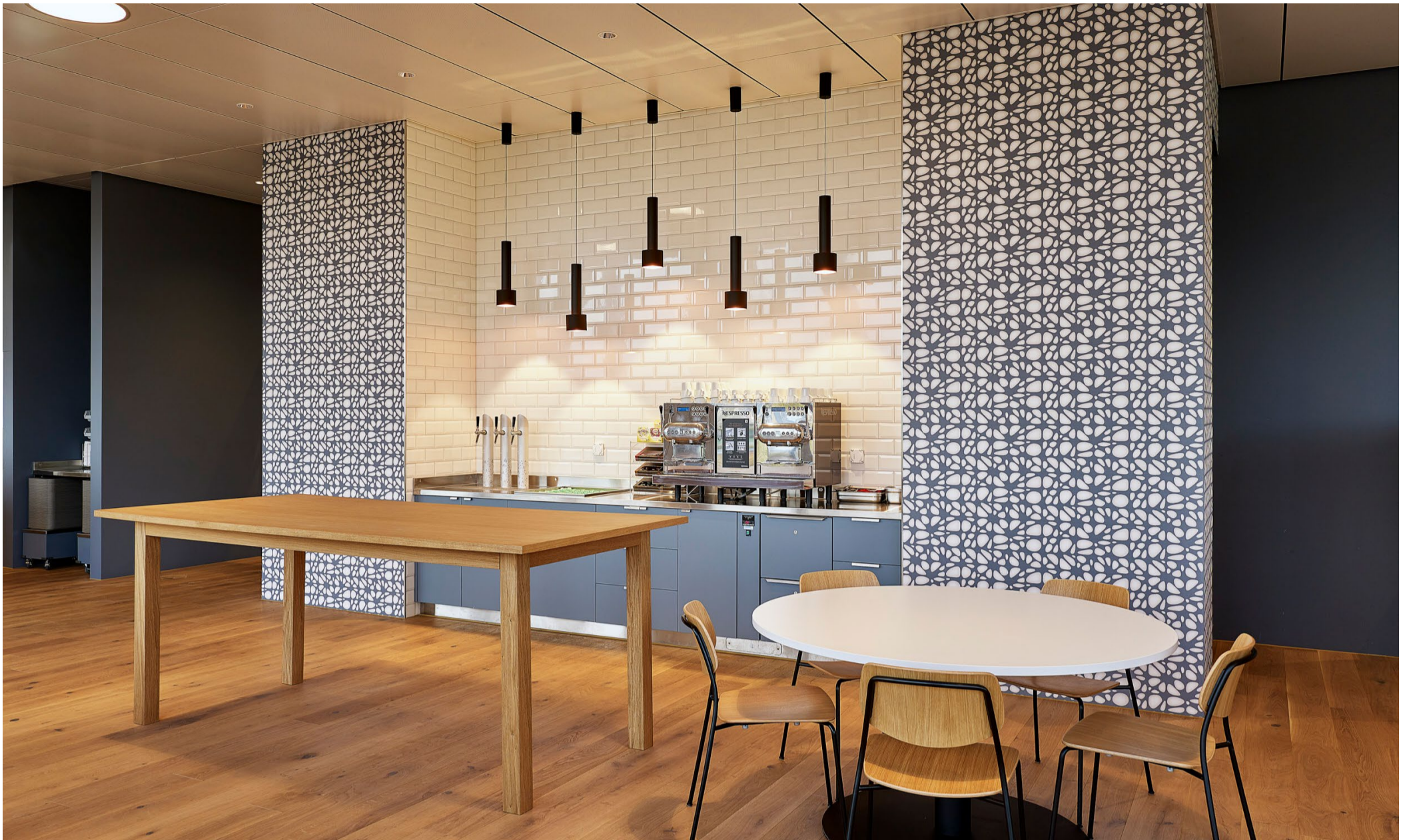
Innenarchitektur: Objekt 13