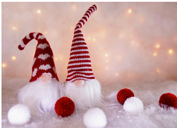
Nisser (škriatok, elf)

Pokračujme Dánskom. Tu sa Vianoce oslavovali ešte skôr, než sa tam objavili prví kresťania. Neboli to „pravé“ Vianoce, ale „jól“, teda svetlé dni pred zimným slnovratom. Dodnes pretrvávajú tradícia vianočného stromčeka postaveného doprostred izby, okolo ktorého