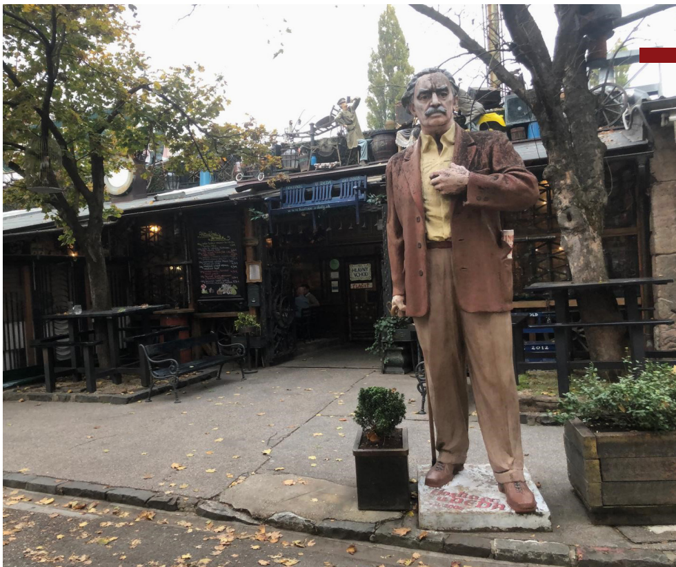
Reštaurácia U deda