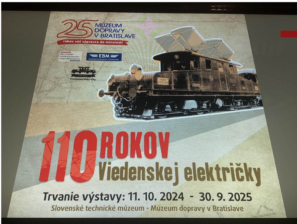
Výročie Viedenskej električky