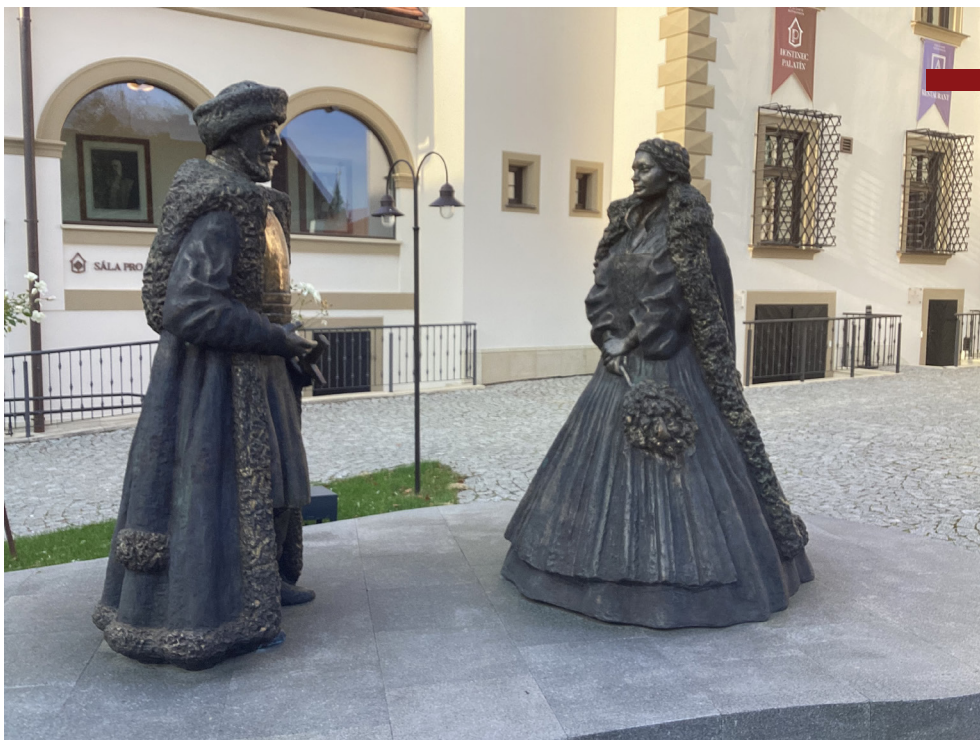
Pálffyovci pred kaštieľom