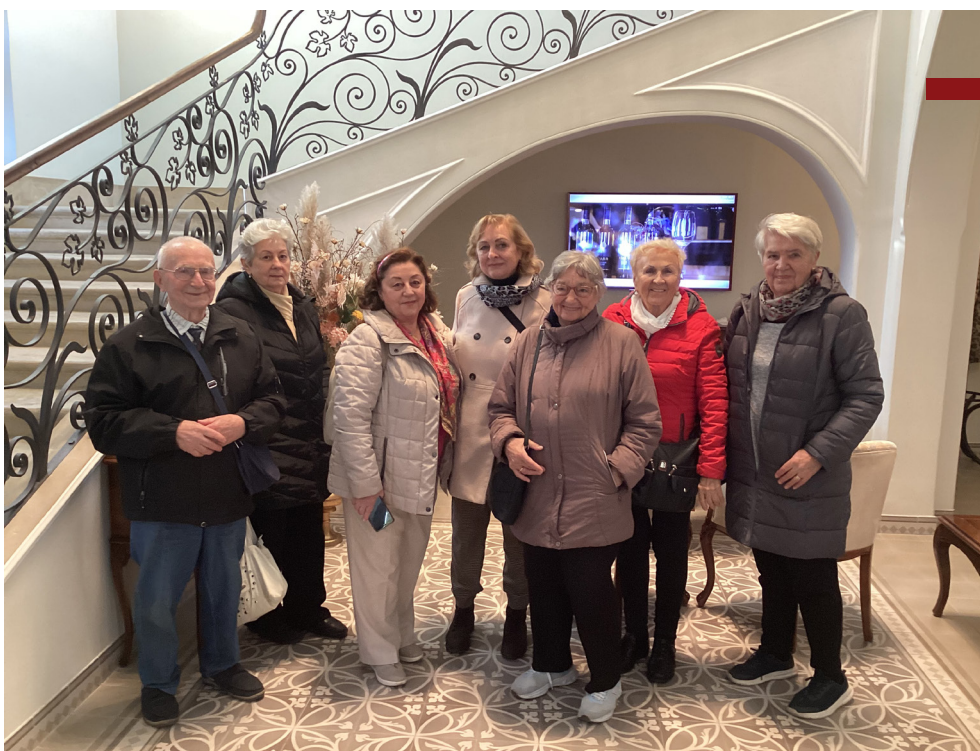
Výletníci v kaštieli