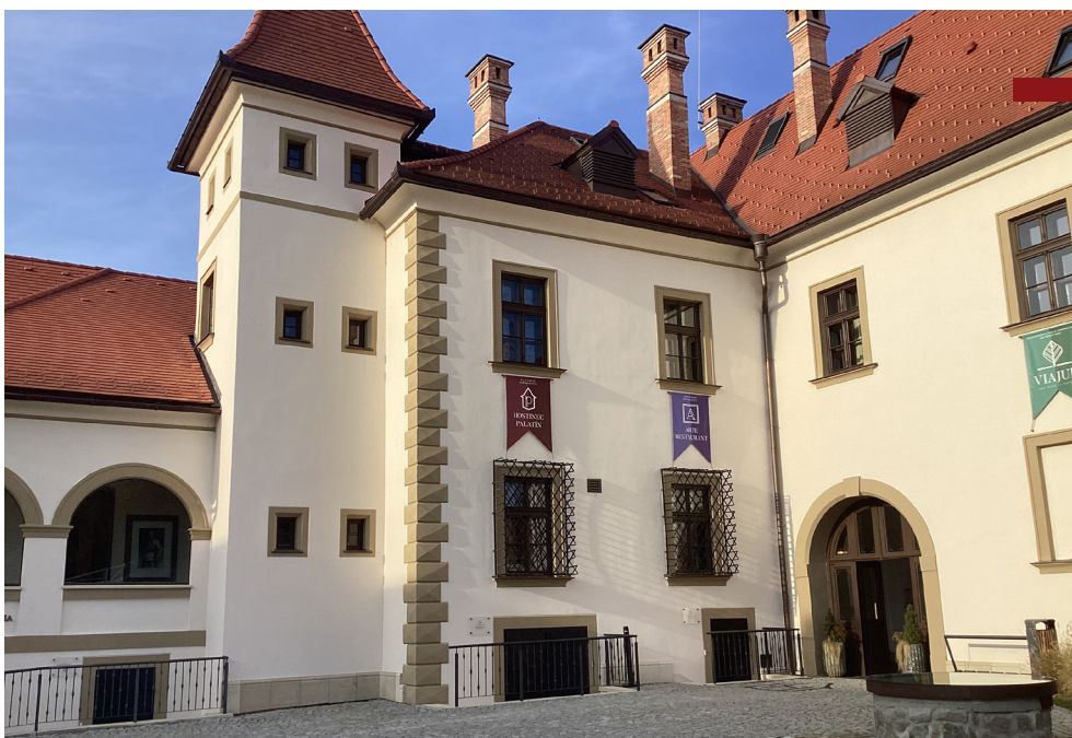
Pálffyovský kaštieľ, Sv. Jur

Na západe Slovenska je viacero pekných kaštieľov. Za pozretie stojí Pálffyovský kaštieľ vo Svätom Jure. Je výborne zrekonštruovaný. Oči sa majú na čom s úľubou popásť! V rámci jeho priestorov sa nachádza aj hostinec. Vo Sv. Jure sú aj dva pekne udržiavané kostoly.