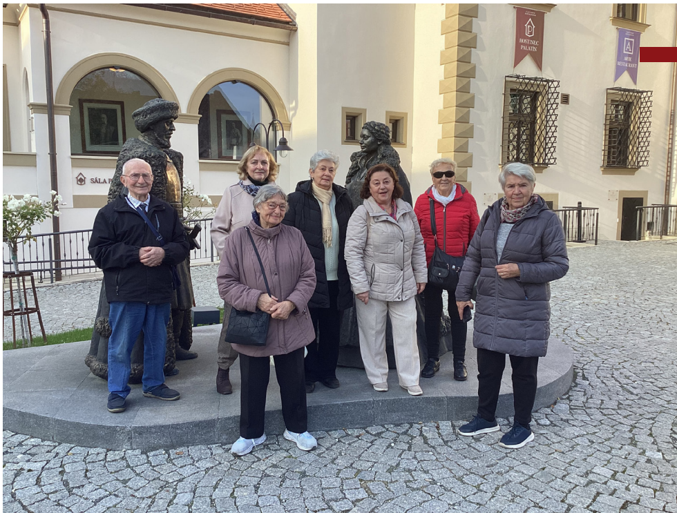
Výletníci pred kaštieľom