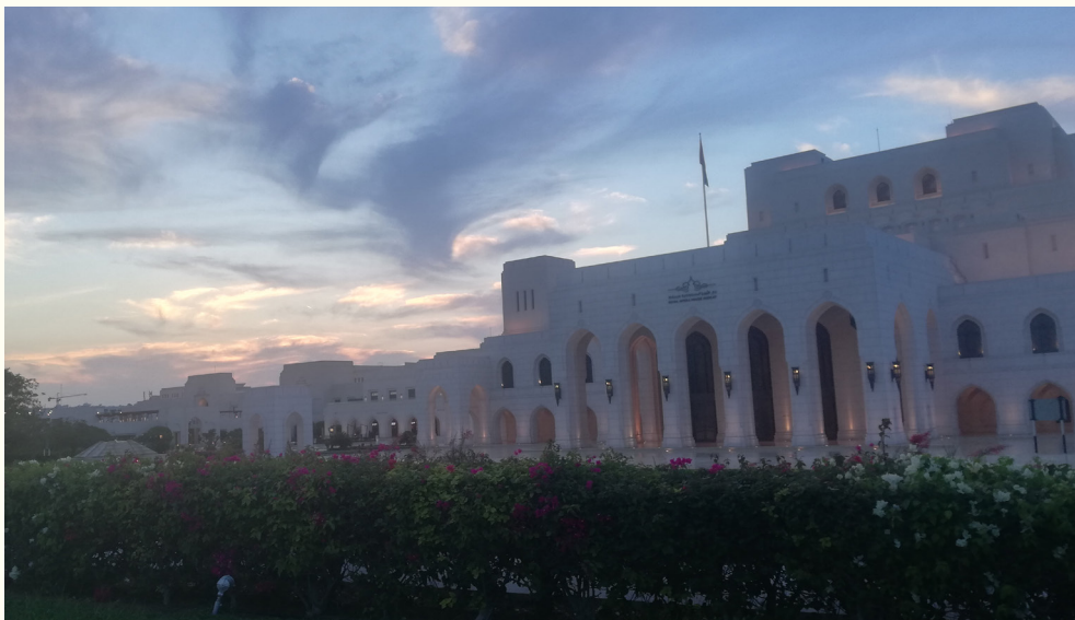
Royal Opera House Maskat

doveké pevnosti, moderné obchodné centrá a operu, jedínú na Arabskom polostrove. Royal Opera House Maskat je nádherná stavba uprostred krásnych záhrad s fontánami, v susedstve luxusného obchodného centra Gallery Opera , s ktorým vytvára jednotný komplex. Bohato zdobený interiér je monumentálny, ale zútulňuje ho drevená výzdoba. Moderný multimediálny systém s veľkými displejmi podáva divákovi informácie a preklad spievaného textu v arabčine a angličtine.