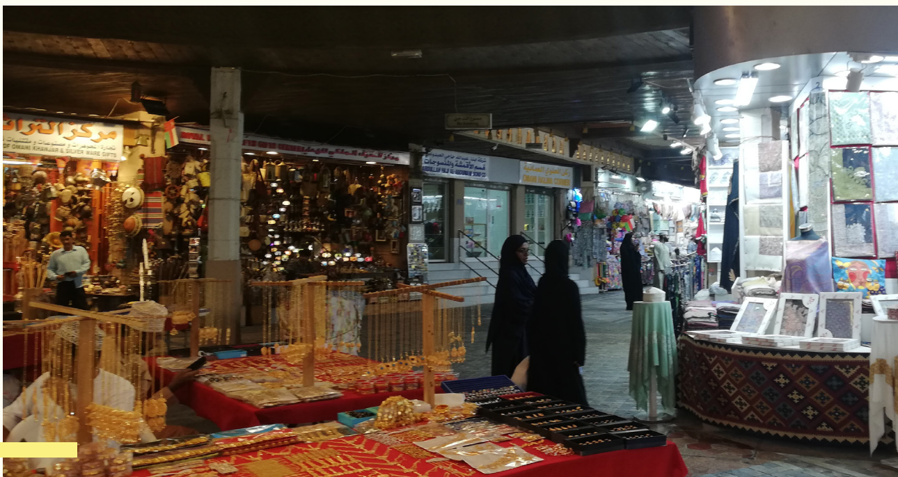
Trh Mutrah Souq; hore exteriér a dole pohľad na interiér