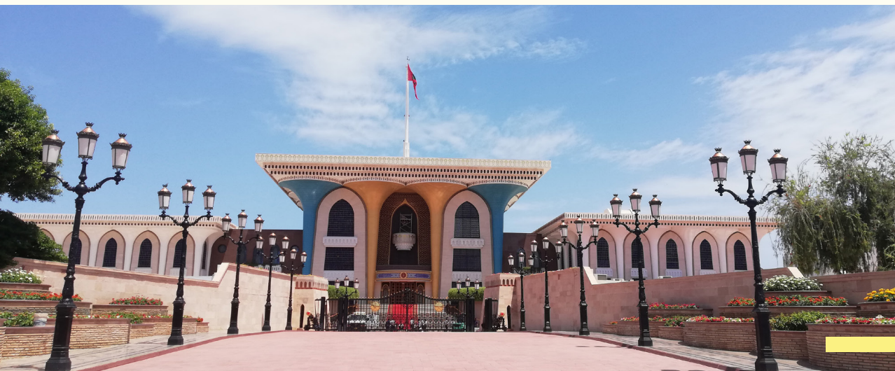
Sultánov palác Al Alam