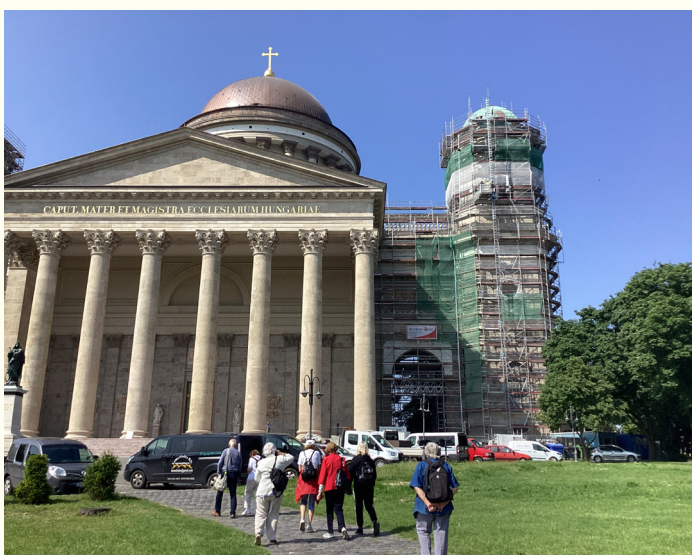
Pohľad na Ostrihom (hore); Katedrála Panny Márie a svätého Vojtecha, alebo Ostrihomská bazilika (vľavo)

Ostrihom v Maďarsku môže zaujať svojou históriou. Osobitne bazilikou - katedrálou Panny Márie.