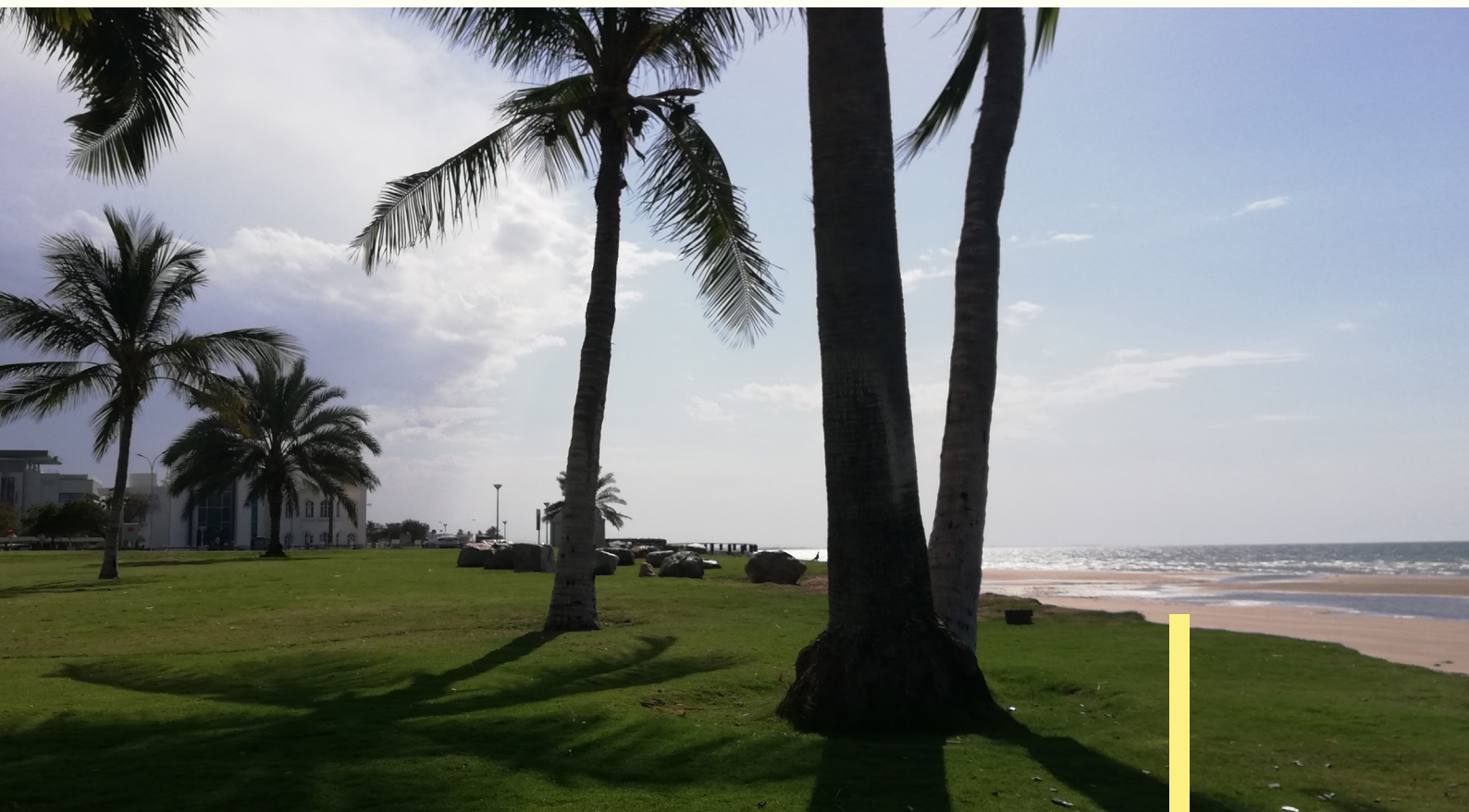
Pláž Qurum Beach

Po návšteve opery oddychujeme na neďalekej pláži Qurum Beach . Prekvapila nás čistota a krásny udržiavaný trávnik nad piesočnatým brehom. More je ďaleko, je odliv, tak sa zložíme na tráve pod palmami, chvíľu sa čvachtáme v po členky plytkej vode a potom len počúvame šumenie mora a kocháme sa nádherným výhľadom. Spočiatku sme sami, k večeru však prichádza stále viac ľudí. Rozložia si prikrývky a pripravujú sa na večerné hodovanie. Je totiž ramadán , kedy moslimovia nesmú jesť počas dňa, tak si to vynahradia po západe slnka.