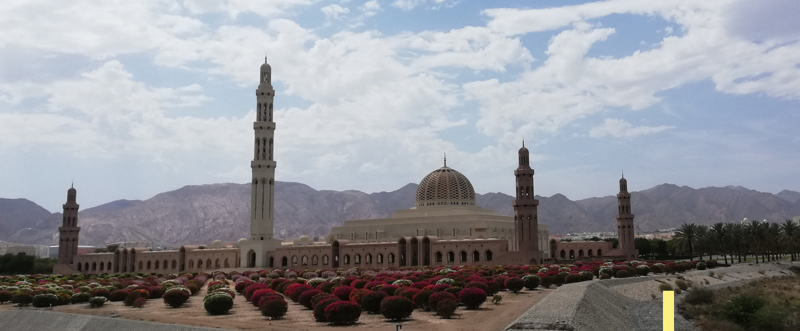
Mešita sultána Kábúsa, interiér a záhrady