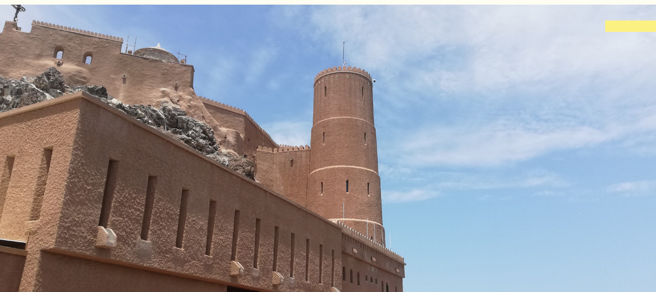
Jedna z pevností strážiacich prístav