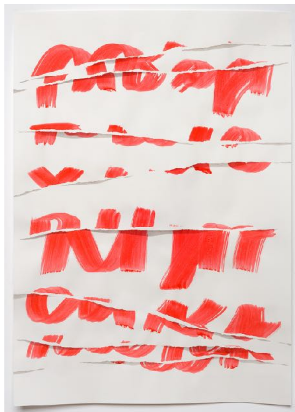
Feldmann: kleine Plakate 1-4 / 75x50 cm, 2022