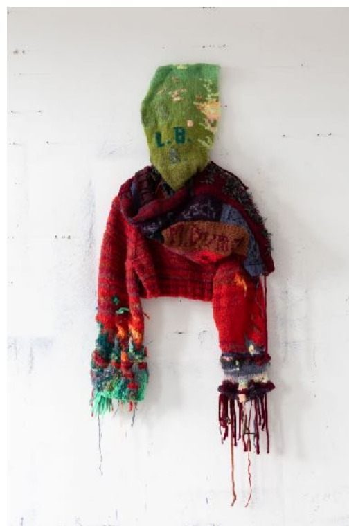
Springer: Mind warming, 2023, Wool, ca 110x60x10cm, Unique

Sibylle Springer references historical artists, especially forgotten female artists from past centuries, and their works. She positions herself somewhat outside the artwork's context to consider the constituent conditions of