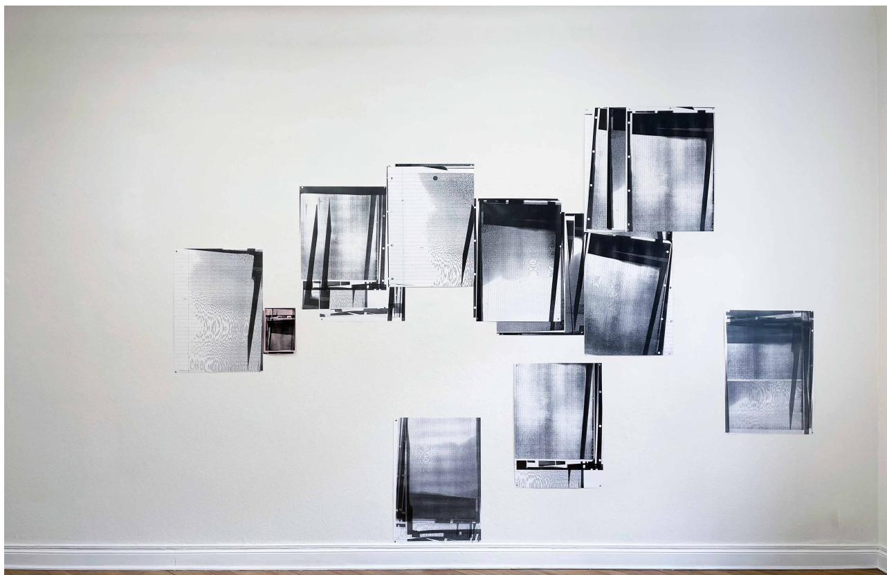
Döbereiner: Fotokopie/Scan/Signalstörung, 2019, Digitaldruck, 84,1 x 59,4 cm, 4 Ed. + 1AP

continuous process of transformation, she focuses on core aspects of painting and drawing such as gesture, texture, and representation. During the creative process of Ursula Döbereiner and Linhan Yu , digital technologies such as scanning, printing, copying, 3D scanning, and photography are used. This raises the question of whether the integration of digital means can influence traditional art genres like painting and drawing, and whether it changes our perspective. The aim is not to make a definitive choice between different techniques but rather to explore their mutual influences in the process of media transformation.