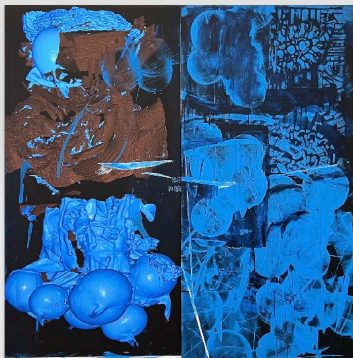
Yu: Second hand notes, 2023, Acryl on canvas, 200x200cm, Unique

a particular work and integrate this perspective. Such aesthetic transformations allow us to reevaluate old works from a contemporary perspective.