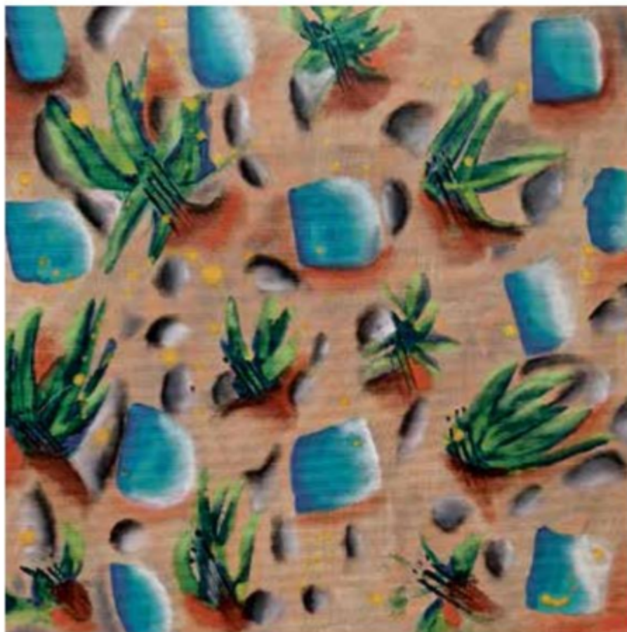
Alejandra Abad, Piovono raggi di sole, 2023.