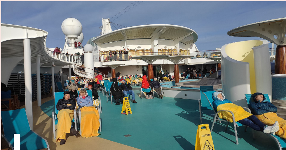
20. február až 4. marec 2023; Zima v severnom Nórsku; loď AIDAmara